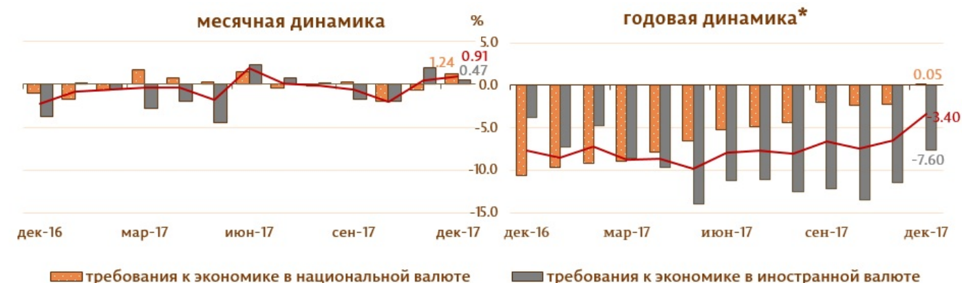
Диаграмма 3. Динамика требований к экономике

Сальдо требований к экономике В соответствии с методологией МВФ, из общей суммы требований к экономике (включающей начисленные проценты по кредитам банков, находящимся в стадии ликвидации) исключаются кредиты нерезидентов, межбанковские кредиты и кредиты, выданные Правительству Республики Молдова в декабре 2017 года увеличилось на 343.0 млн. леев (0.9%) за счет роста требований к экономике в национальной валюте на 266.2 млн. леев (1.2%) и требований в иностранной валюте (выраженных в молдавских леях) на 76.8 млн. леев или на 0.5% (диаграмма № 3).