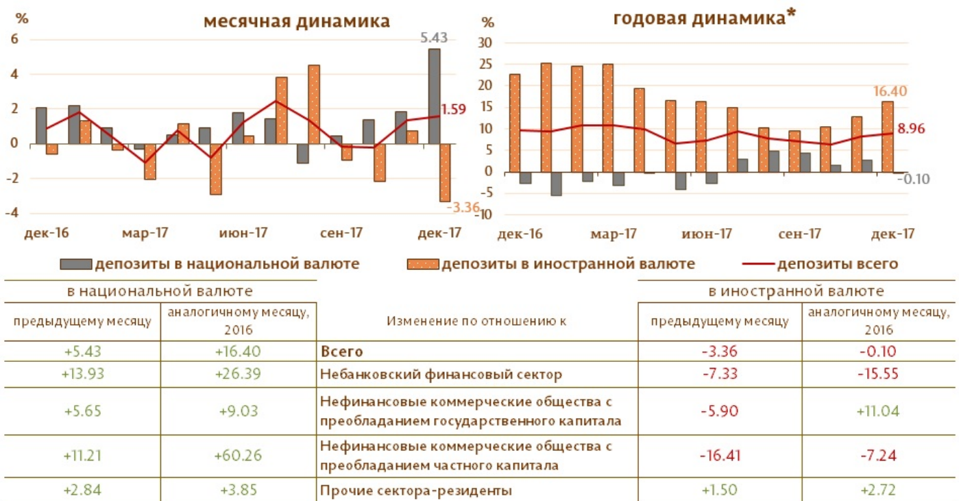
Диаграмма 2. Динамика депозитов Структура депозитов группируется по институциональным секторам в соответствии с Инструкцией о порядке составления и предоставления банками отчета по денежной статистике (Monitorul Oficial al Republicii Moldova nr. 206-215 din 2 decembrie 2011) [1]

Рост денежной массы М3 в отчетном периоде, исходя из динамики ее балансирующих статей, был определен увеличением чистых внешних активов Рассчитывается путем уменьшения внешних активов на сумму соответствующих внешних пассивов.