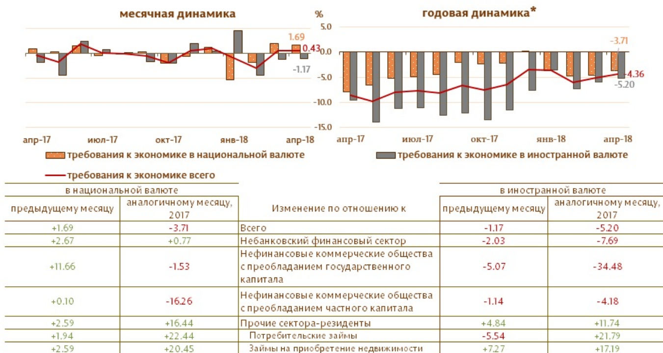
Диаграмма 3. Динамика требований к экономике

Следует отметить, что требования к экономике в иностранной валюте, выраженные в долларах США, в течении отчетного периода снизились на 14.9 млн. долларов США (1.5%).