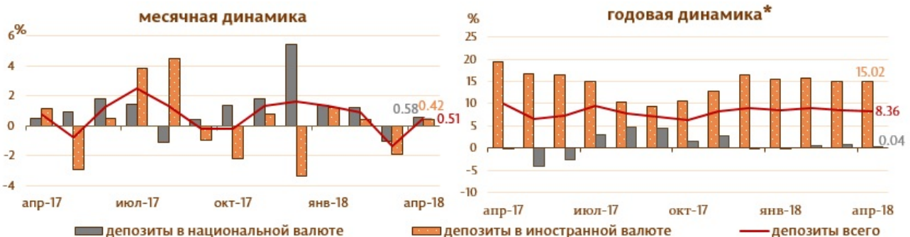
Диаграмма 2. Динамика депозитов Структура депозитов группируется по институциональным секторам в соответствии с Инструкцией о порядке составления и предоставления банками отчета по денежной статистике (Monitorul Oficial al Republicii Moldova nr. 206-215 din 2 decembrie 2011) [1]

Сальдо депозитов в национальной валюте увеличилось на 198.2 млн. леев и составило 34654.1 млн. леев, составив долю в 59.0 % от общего сальдо депозитов, а сальдо депозитов в иностранной валюте (пересчитанное в молдавских леех) увеличилось на 101.9 млн. леев, до уровня 24106.1 млн. леев, с долей 41.0 % (диаграмма № 2).