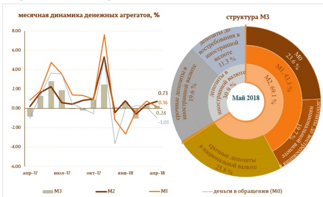
Диаграмма 1. Денежный агрегат M3

Следует отметить, что денежные агрегаты Деньги в обращении (M0) и Денежная масса (M1) Денежная масса M1 включает деньги в обращении и депозиты резидентов до востребования в молдавских леях. выросли по отношению к маю 2017 года на 9.5 и на 19.5%, соответственно.