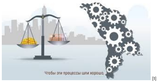
Роль Национального банка Молдовы [1]