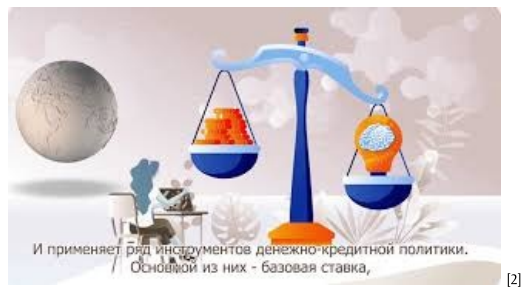
Почему принимаются решения по денежно-кредитной политике [2]