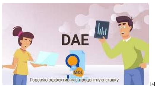
На что обращать внимание при получении кредита [4]