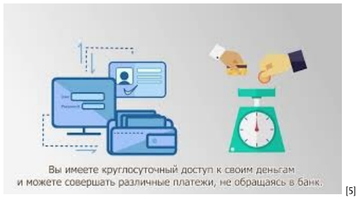
Как безопасно использовать свою платежную карту [5]