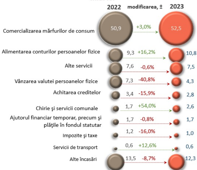
Principalele surse de încasări, cumulativ ianuarie – iulie, mld. lei