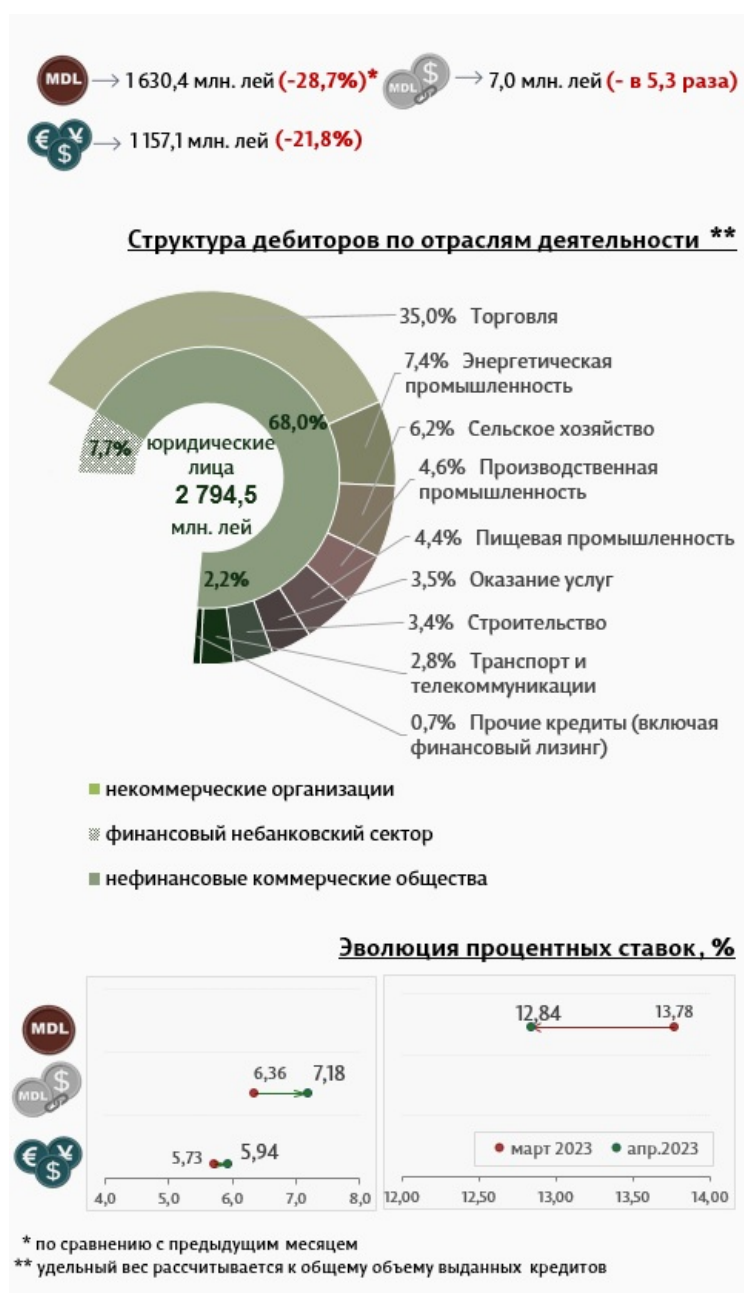
Инфографика 3. Вновь выданные кредиты юридическим лицам

По сравнению с предыдущим месяцем, в отчетном периоде юридические лица затребовали меньше кредитов как в национальной валюте (-28,7%), так и в иностранной валюте (-21,8%) и привязанных к курсу валюты (- в 5,3 раза). Средняя ставка по кредитам, выданным юридическим лицам (Инфографика 3) в национальной валюте, снизилась на 0,94 процентных пункта, до уровня 12,84%. В то же время средняя ставка по кредитам, выданным в иностранной валюте, увеличилась на 0,21 процентных пункта и составила 5,94%.