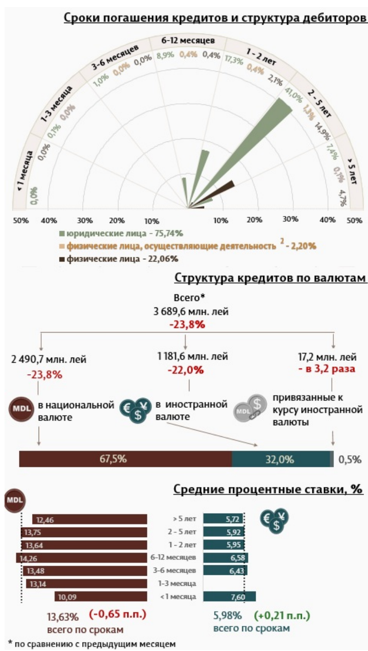
Инфографика 1. Динамика вновь выданных кредитов

В апреле 2023 вновь выданные кредиты 1 (Инфографика 1) составили 3 689,6 миллиона леев, на 23,8% ниже марта 2022 г. Основную часть (67,5%) составляют кредиты в национальной валюте, которые составили 2 490,7 миллиона леев, на 23,8% ниже по сравнению с предыдущим месяцем.