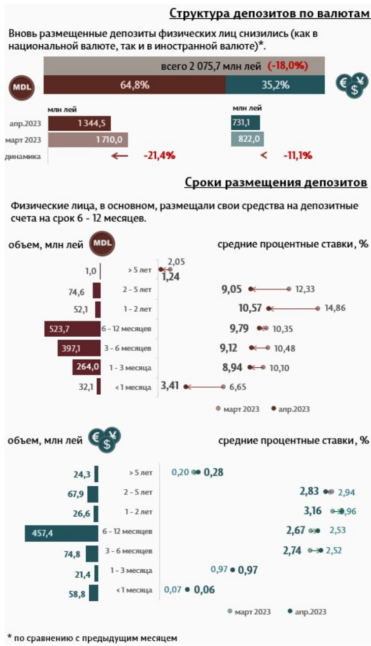
Инфографика 2. Вновь привлеченные срочные депозиты от физических лиц

Самыми привлекательными, с точки зрения сроков, были депозиты со сроком от 6 до 12 месяцев с долей 42,0% от всего привлеченных срочных депозитов. Депозиты физических лиц, привлеченные на этот срок, составили 30,2% от всего привлеченных срочных депозитов.