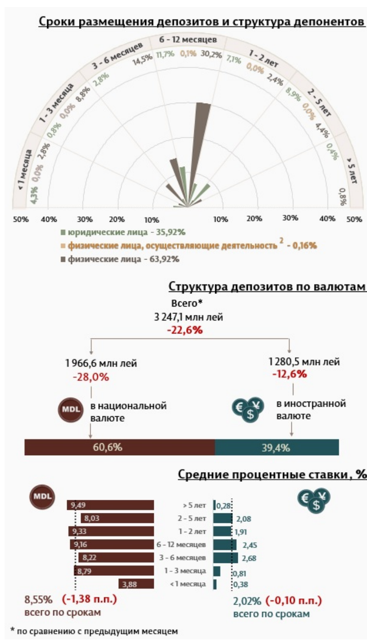
Инфографика 1. Динамика вновь привлеченных депозитов

Средняя номинальная ставка по новым депозитам, привлеченным в национальной валюте, снизилась на 1,38 процентных пункта по сравнению с предыдущим месяцем и составила 8,55%. Средняя номинальная ставка по депозитам в иностранной валюте снизилась на 0,10 процентных пункта, составив 2,02%.