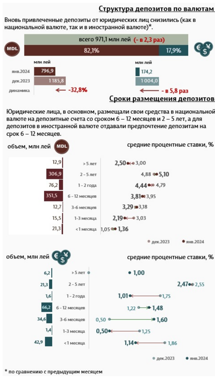
Инфографика 3. Вновь привлеченные срочные депозиты от юридических лиц

Депозиты юридических лиц в национальной валюте составили 796,9 миллиона леев, а в иностранной валюте – 174,2 миллиона леев.