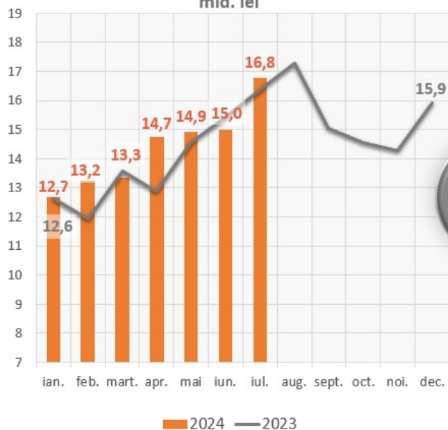
Scopurile eliberărilor, cumulativ ianuarie - iulie 2024, mld. lei