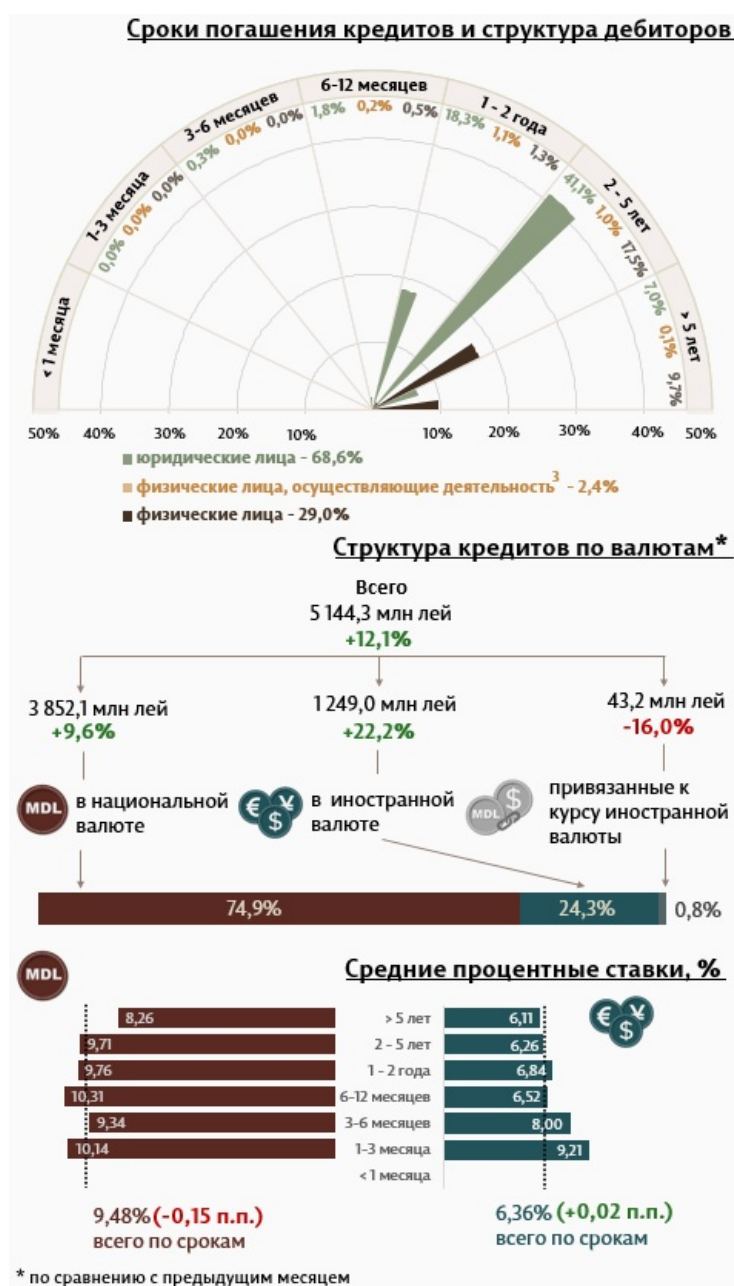
Инфографика 1. Динамика вновь выданных кредитов 2

В марте 2024 г. вновь выданные кредиты 1 составили 5 144,3 миллиона леев, на 12,1% выше февраля 2024 г. (Инфографика 1). Основная часть (74,9%) пришлась на кредиты в национальной валюте, которые составили 3 852,1 миллиона леев, на 9,6% выше по сравнению с предыдущим месяцем.