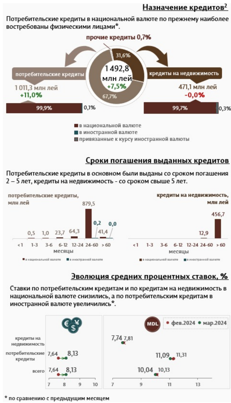
Инфографика 2. Вновь выданные кредиты физическим лицам 3

Кредиты на недвижимость составляют 31,6% от всех кредитов, выданных физическим лицам, и были представлены в основном в национальной валюте (99,7% от общего объема кредитов на недвижимость).