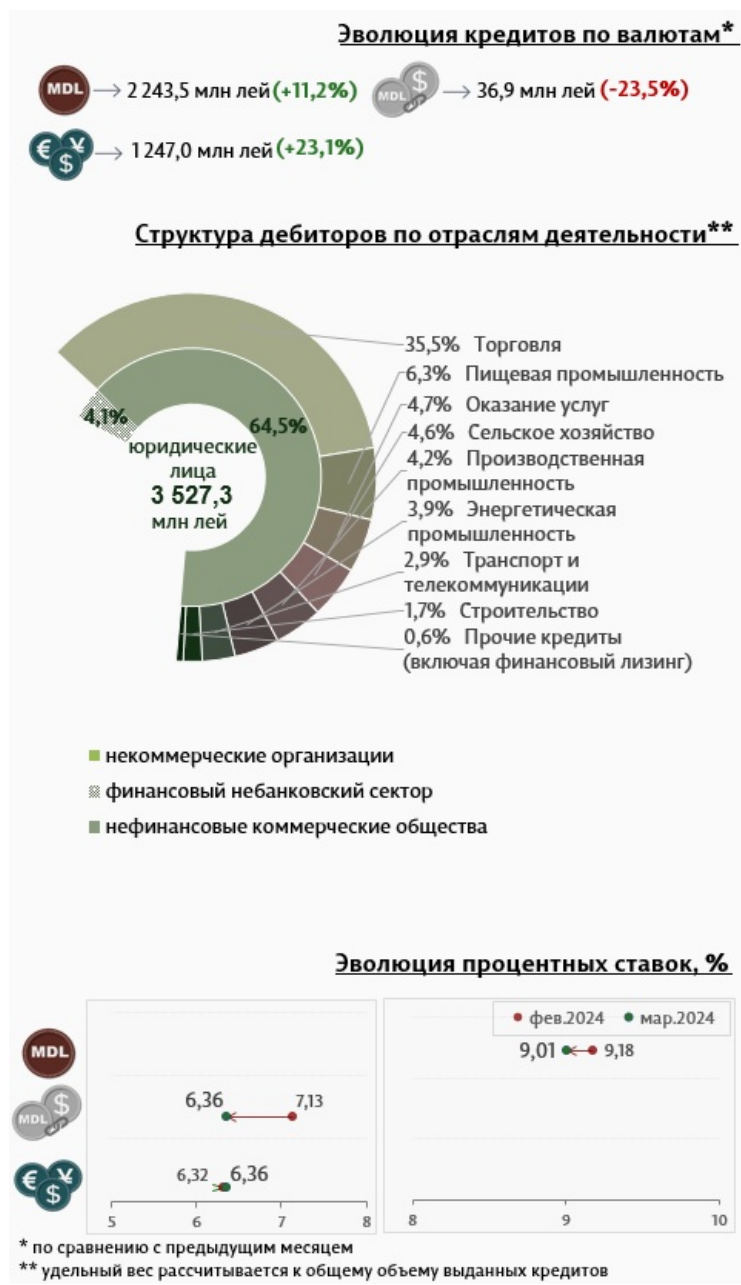
Инфографика 3. Вновь выданные кредиты юридическим лицам

Средняя ставка по кредитам, выданным юридическим лицам в национальной валюте, снизилась на 0,17 процентных пункта, до уровня 9,01%. В то же время средняя ставка по кредитам, выданным в иностранной валюте, увеличилась на 0,04 процентных пункта и составила 6,36%.