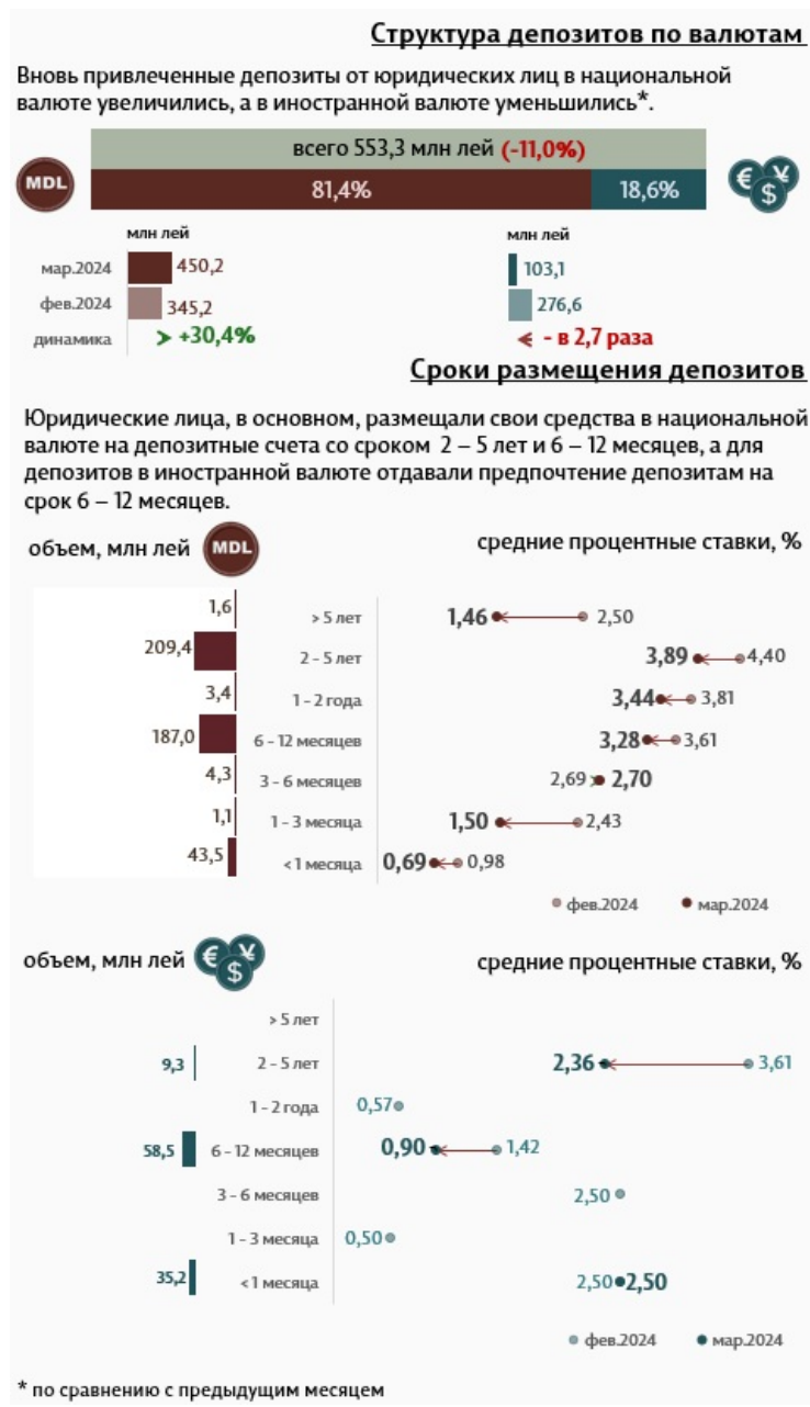
Инфографика 3. Вновь привлеченные срочные депозиты от юридических лиц

Средняя ставка по депозитам, привлеченным от юридических лиц в национальной валюте, снизилась на 0,43 процентных пункта, до уровня 3,30%. В то же время, средняя ставка по депозитам, привлеченным в иностранной валюте, снизилась на 0,40 процентных пункта и составила 1,58%.