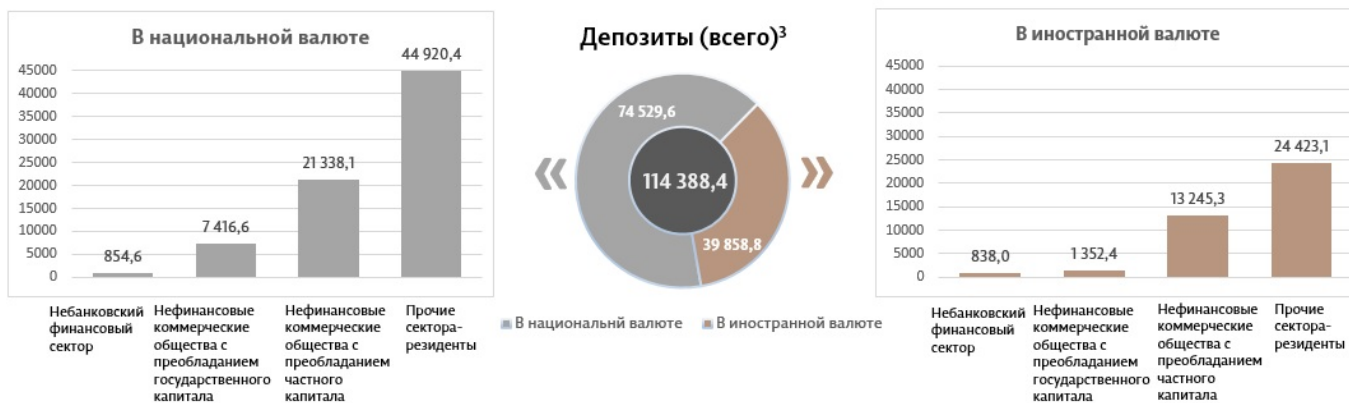
Диаграмма 3. Объем депозитов в марте 2024 7 г., миллионы леев

Сальдо депозитов в национальной валюте увеличилось на 270,1 миллиона леев по сравнению с предыдущим месяцем и составило 74 529,6 миллиона леев, составив долю 65,2% от общего сальдо депозитов. В то же время сальдо депозитов в иностранной валюте (пересчитанное в леях) увеличилось на 54,7 миллиона леев по сравнению с предыдущим месяцем, до уровня 39 858,8 миллиона леев, с долей 34,8% (диаграмма 3).