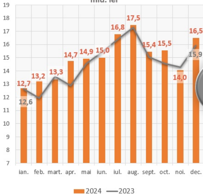
Scopurile eliberărilor, cumulativ anul 2024, mld. lei