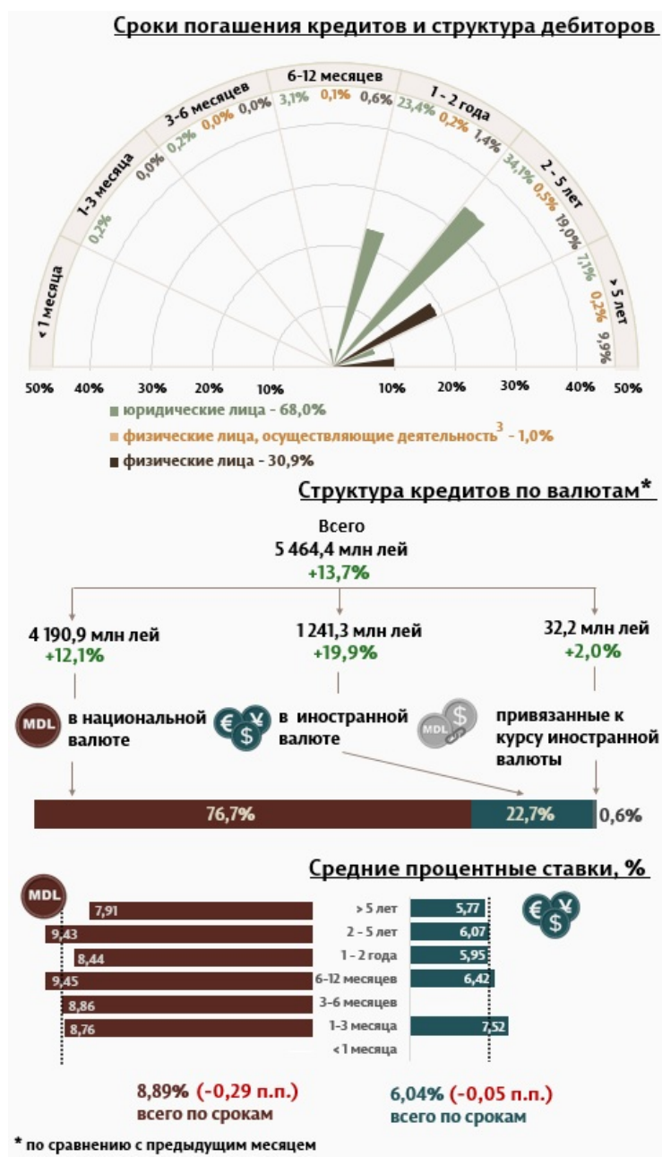
Инфографика 1. Динамика вновь выданных кредитов 2

В июне 2024 г. вновь выданные кредиты 1 составили 5 464,4 миллиона леев, на 13,7% выше, чем в мае 2024 г. (Инфографика 1). Основная часть (76,7%) пришлась на кредиты в национальной валюте, которые составили 4 190,9 миллиона леев, увеличившись на 12,1% по сравнению с предыдущим месяцем.