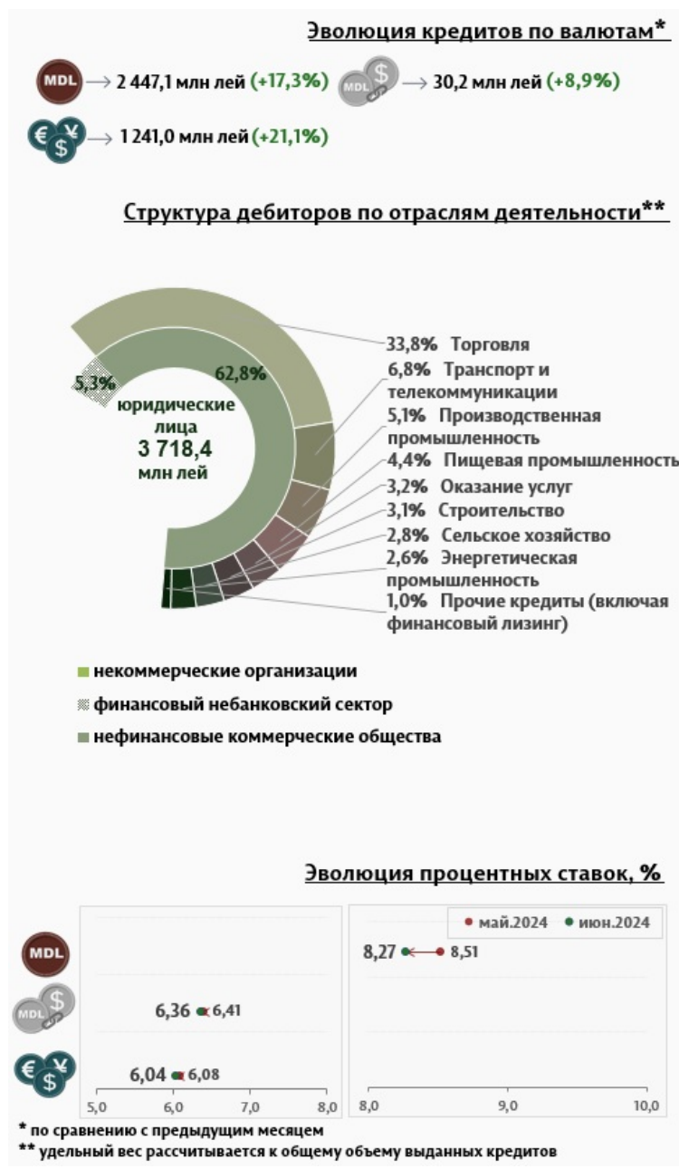
Инфографика 3. Вновь выданные кредиты юридическим лицам

Средняя ставка по кредитам, выданным юридическим лицам в национальной валюте, снизилась на 0,24 процентного пункта, до уровня 8,27%. В то же время средняя ставка по кредитам, выданным в иностранной валюте, снизилась на 0,04 процентного пункта и составила 6,04%.