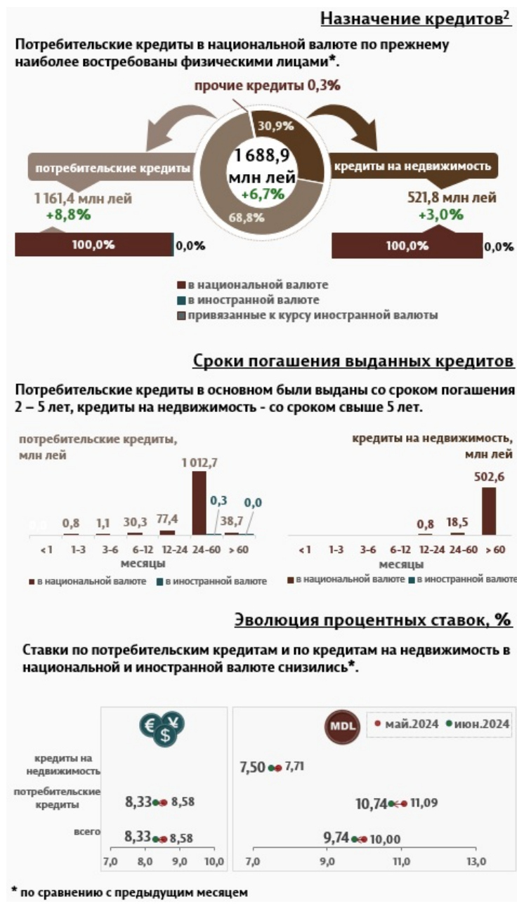
Инфографика 2. Вновь выданные кредиты физическим лицам

Кредиты на недвижимость были представлены только в национальной валюте и составляют 30,9% от всех кредитов выданных физическим лицам.