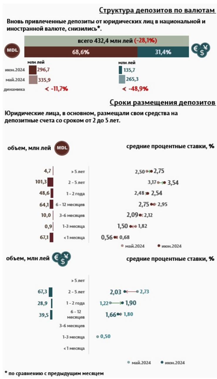
Инфографика 3. Вновь привлеченные срочные депозиты от юридических лиц

Средняя ставка по депозитам, привлеченным от юридических лиц в национальной валюте, снизилась на 0,23 п. п., до уровня 2,46%. В то же время средняя ставка по депозитам, привлеченным в иностранной валюте, увеличилась на 0,21 п. п. и составила 1,89%.