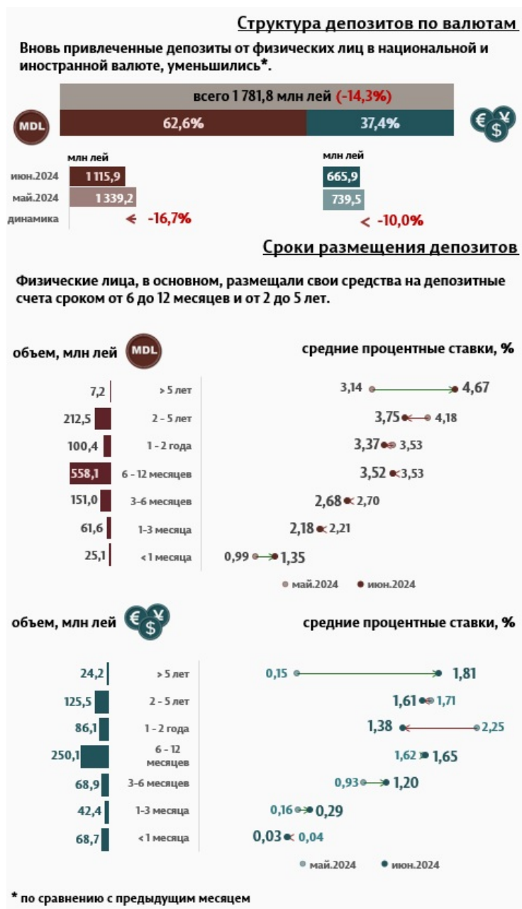
Инфографика 2. Вновь привлеченные срочные депозиты от физических лиц

В отчетном месяце депозиты физических лиц составили 1 781,8 миллиона леев, уменьшившись на 14,3% по сравнению с предыдущим месяцем (Инфографика 2). Наиболее востребованными были депозиты со сроком от 6 до 12 месяцев, доля которых составила 45,4% от общего объема депозитов физических лиц.