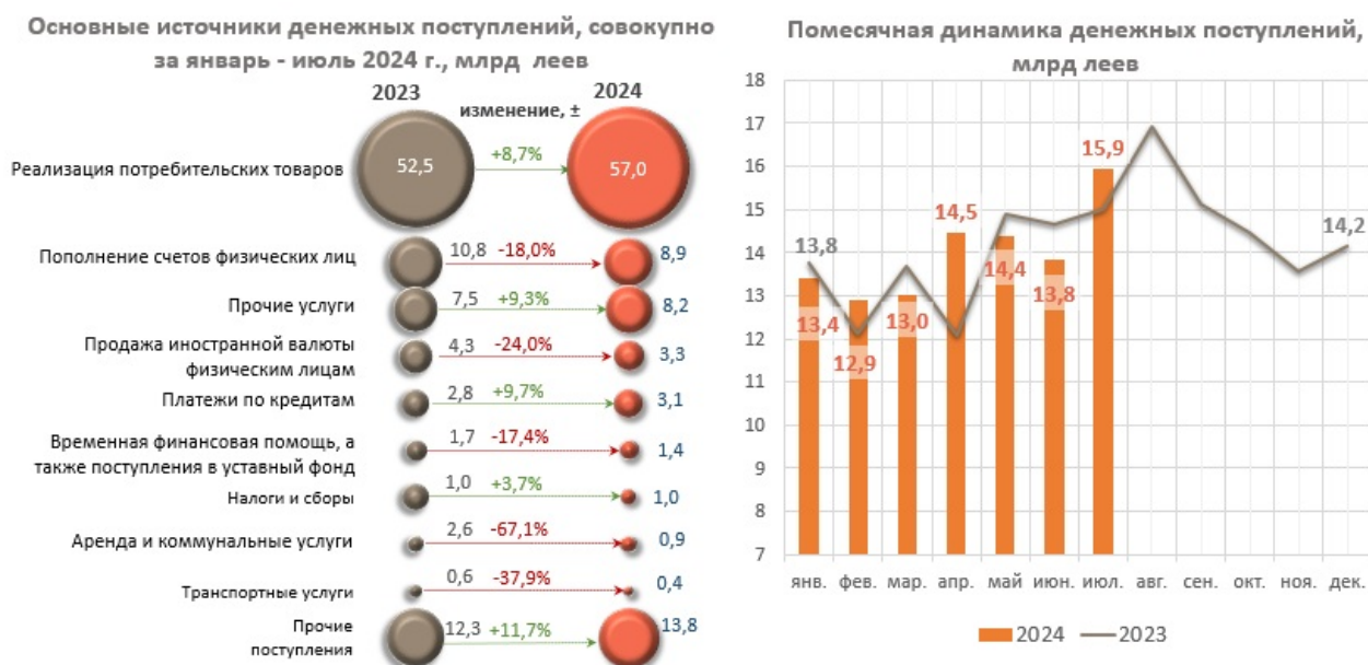
Диаграмма nr. 1. Основные источники поступления денежной наличности в кассах банков и их ежемесячная динамика 4

При этом, в январе – июле 2024 г. значительно сократились поступления наличных денежных средств на текущие и депозитные счета физических лиц на 1 950,8 млн леев (-18,0%), поступления от аренды и коммунальных услуг на 1 745,7 млн леев (-67,1%), а также уменьшилось поступление наличности от продажи иностранной валюты физическим лицам на 1 033,6 млн леев (-24,0%), составив 3 271,7 млн леев (эквивалент 184,2 млн долларов США 3 ).