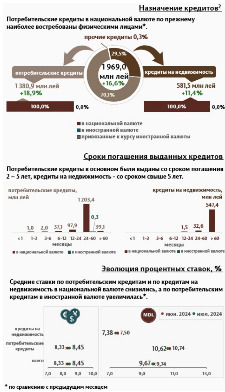
Инфографика 2. Вновь выданные кредиты физическим лицам

Кредиты на недвижимость были представлены только в национальной валюте и составляют 29,5% от общего объема кредитов, выданных физическим лицам.