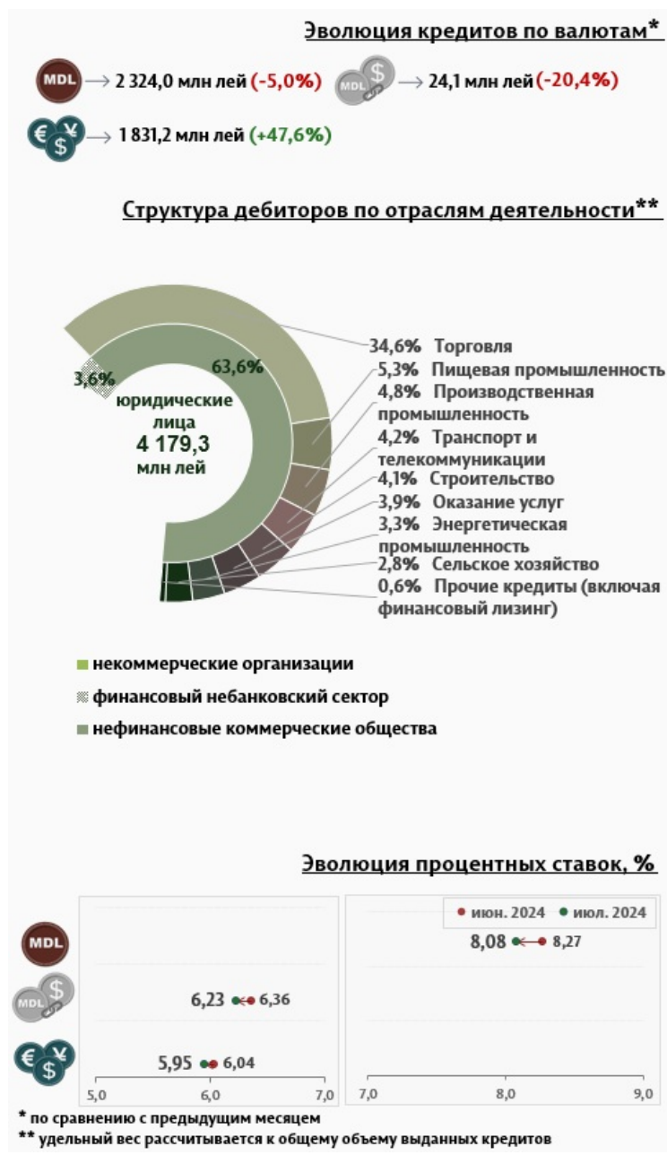
Инфографика 3. Вновь выданные кредиты юридическим лицам 2

Средняя ставка по кредитам, выданным юридическим лицам в национальной валюте, снизилась на 0,19 п.п., до уровня 8,08%. В то же время средняя ставка по кредитам, выданным в иностранной валюте, снизилась на 0,09 п.п. и составила 5,95%.