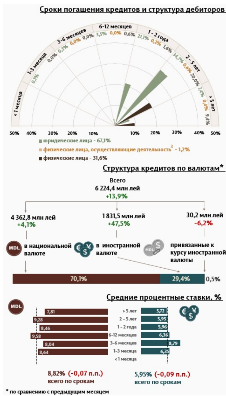
Инфографика 1. Динамика вновь выданных кредитов 2

С точки зрения сроков выданных кредитов, наибольшим спросом пользовались кредиты на срок от 2 до 5 лет, доля которых составила 55,3% от общего объема выданных кредитов. Объем данных кредитов, выданных юридическим лицам, составил 34,7% от общего объема кредитов.