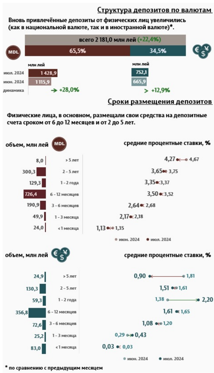
Инфографика 2. Вновь привлечённые срочные депозиты от физических лиц

В отчетном месяце депозиты физических лиц составили 2 181,0 миллиона леев, увеличившись на 22,4% по сравнению с предыдущим месяцем (Инфографика 2). Наиболее востребованными были депозиты со сроком от 6 до 12 месяцев, доля которых составила 49,7% от общего объема депозитов физических лиц.