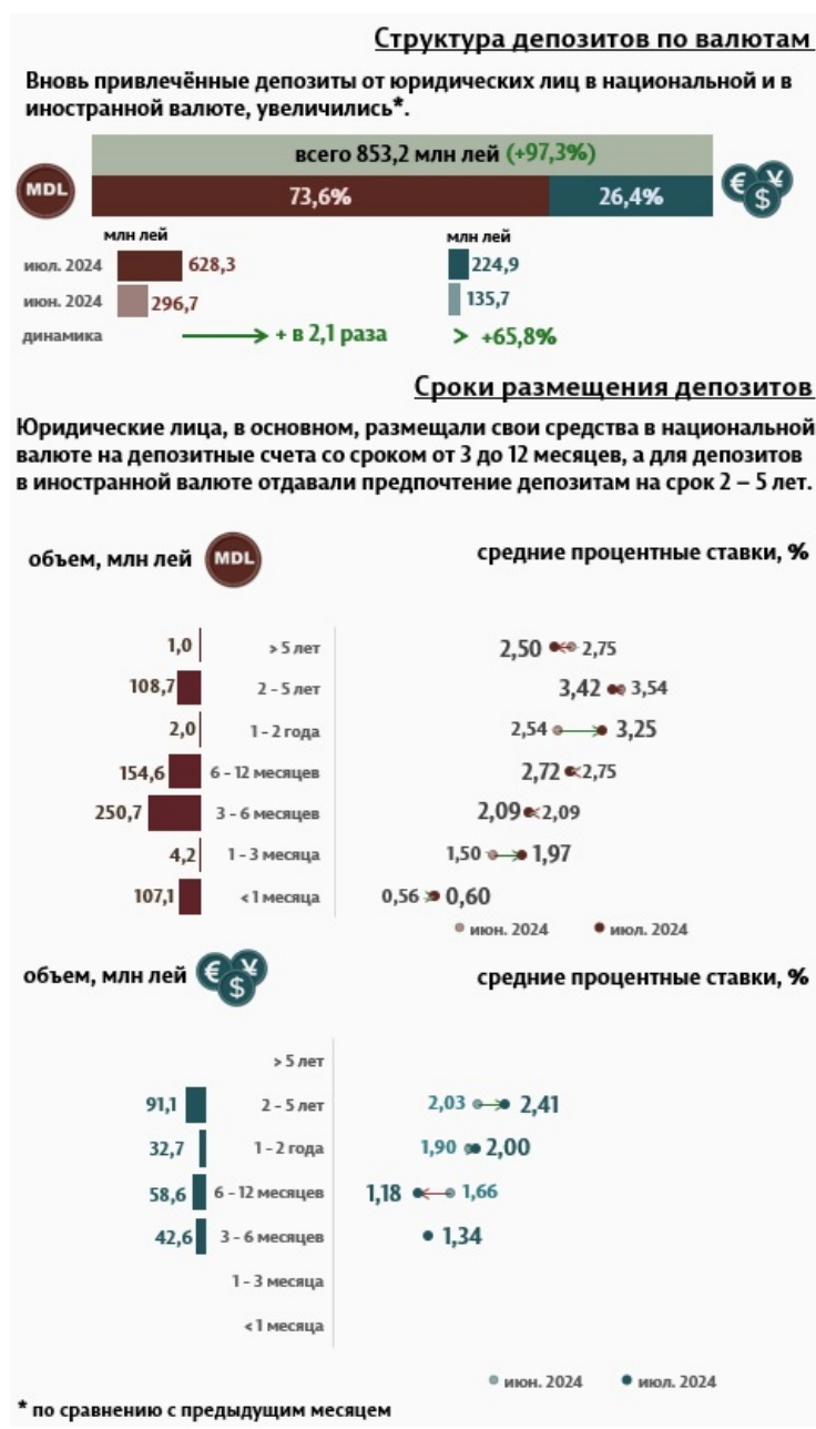
Инфографика 3. Вновь привлечённые срочные депозиты от юридических лиц

юридических лиц в национальной валюте составили 628,3 миллиона леев, а в иностранной валюте – 224,9 миллиона леев.