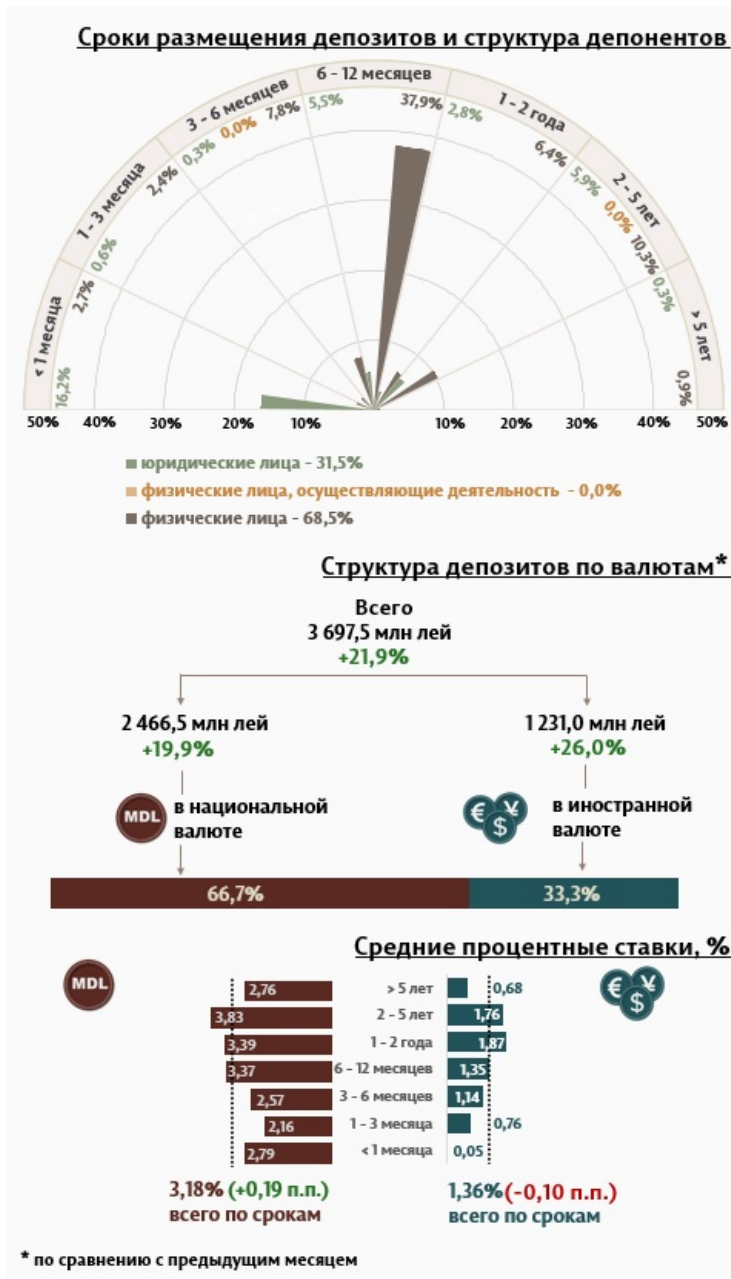
Инфографика 1. Динамика вновь привлечённых депозитов

В августе 2024 г. вновь привлечённые срочные депозиты 1 (Инфографика 1) составили 3 697,5 миллиона леев, увеличившись на 21,9% по сравнению с июлем 2024 года. Привлечённые депозиты в национальной валюте составили наибольшую долю в 66,7% или 2 466,5 миллиона леев, что на 19,9% больше по сравнению с предыдущим месяцем. Депозиты, привлечённые в иностранной валюте, составили 1 231,0 миллиона леев, увеличившись на 26,0% по сравнению с предыдущим месяцем.