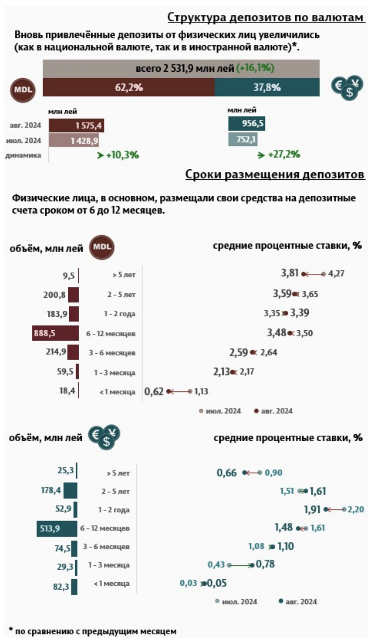
Инфографика 2. Вновь привлечённые срочные депозиты от физических лиц

В отчетном месяце депозиты физических лиц составили 2 531,9 миллиона леев, увеличившись на 16,1% по сравнению с предыдущим месяцем (Инфографика 2). Наиболее востребованными были депозиты со сроком от 6 до 12 месяцев, доля которых составила 55,4% от общего объема депозитов физических лиц.