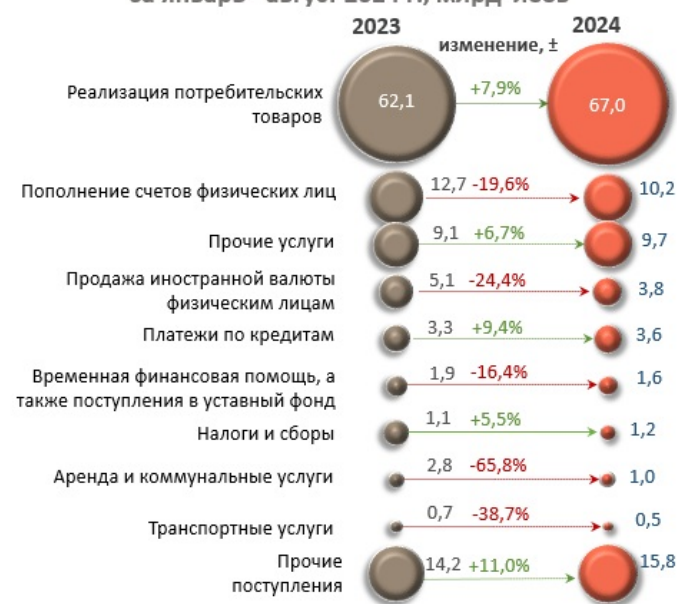
Основные источники денежных поступлений, совокупно за январь - август 2024 г., млрд леев