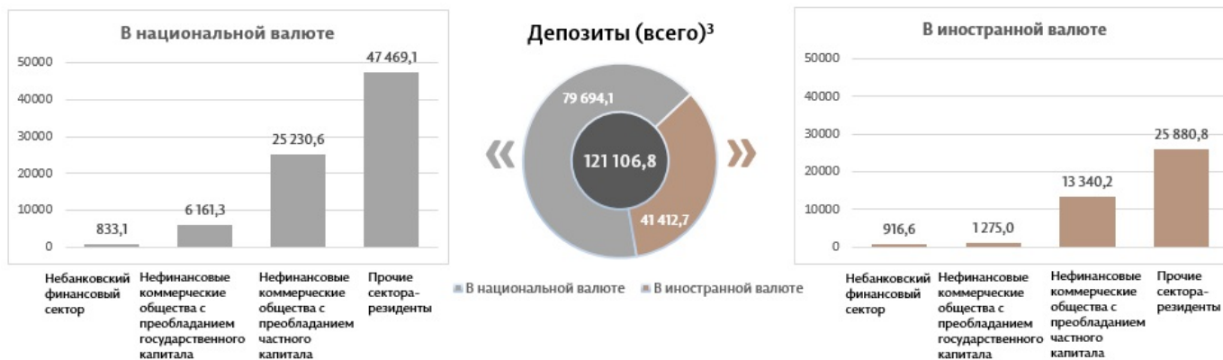
Диаграмма 3. Объём депозитов в сентябре 2024 г. 7 , миллионы леев

Сальдо депозитов в национальной валюте увеличилось на 844,8 миллиона леев по сравнению с предыдущим месяцем, составив 79 694,1 миллиона леев, или 65,8% от общего сальдо депозитов. В то же время сальдо депозитов в иностранной валюте (пересчитанное в леях) уменьшилось на 636,4 миллиона леев по сравнению с предыдущим месяцем, до уровня 41 412,7 миллиона леев, с долей 34,2% (диаграмма 3).