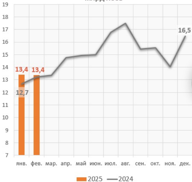
Помесячная динамика выдач денежных средств, млрд леев