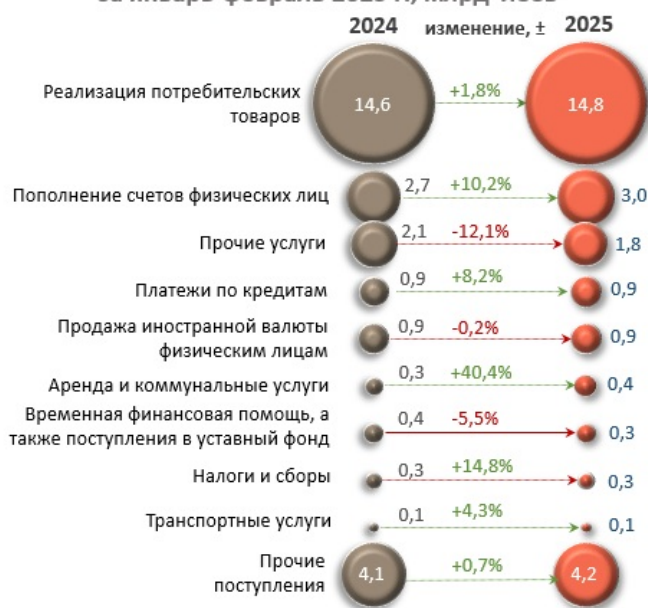
Основные источники денежных поступлений, совокупно за январь-февраль 2025 г., млрд леев