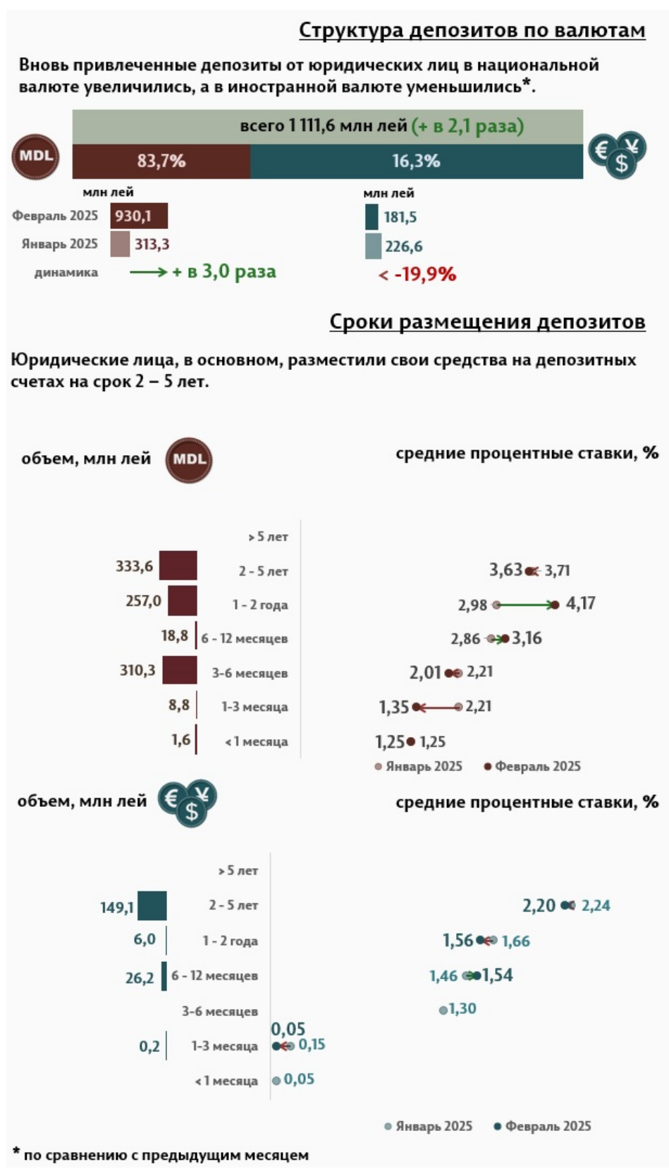
Инфографика 3. Вновь привлечённые срочные депозиты от юридических лиц

В феврале 2025 г., по сравнению с предыдущим месяцем, объём депозитов юридических лиц в национальной валюте увеличился в 3,0 раза, а в иностранной валюте уменьшился на 19,9% (Инфографика 3). Депозиты юридических лиц в национальной валюте составили 930,1 миллиона леев, а в иностранной валюте – 181,5 миллиона леев. По сравнению с февралём 2024 г., объём депозитов юридических лиц в национальной валюте увеличился в 2,7 раза, а в иностранной валюте уменьшился на 34,4%.