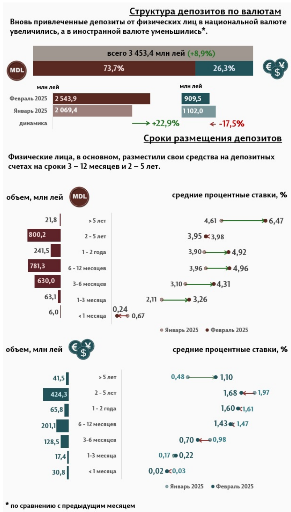
Инфографика 2. Вновь привлечённые срочные депозиты от физических лиц

Средняя процентная ставка по депозитам, привлечённым в национальной валюте от физических лиц, по сравнению с предыдущим месяцем повысилась на 0,71 п.п., до уровня 4,44%. Средняя процентная ставка по депозитам, привлечённым в иностранной валюте, снизилась на 0,11 п.п. и составила 1,37%