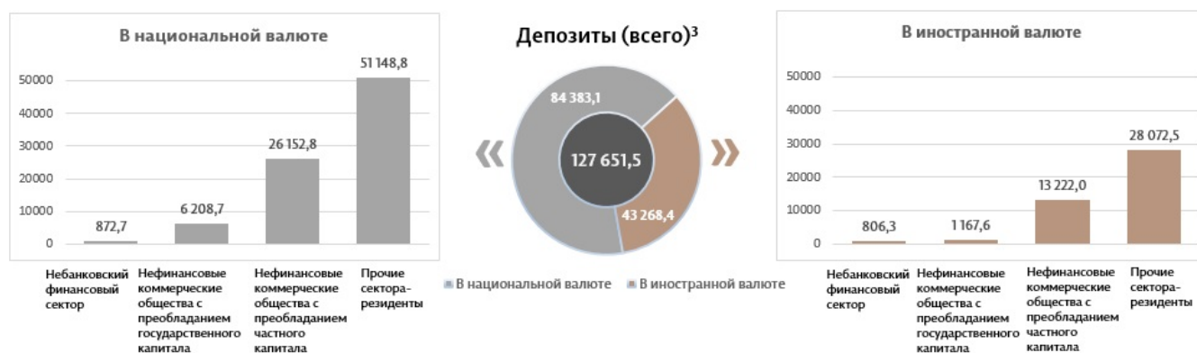
Диаграмма 3. Объём депозитов в феврале 2025 г. 7 , миллионы леев

Сальдо депозитов в национальной валюте увеличилось на 1 693,8 миллиона леев по сравнению с предыдущим месяцем, составив 84 383,1 миллиона леев, или 66,1% от общего сальдо депозитов. В то же время сальдо депозитов в иностранной валюте (пересчитанное в леях) увеличилось на 171,6 миллиона леев по сравнению с предыдущим месяцем, до уровня 43 268,4 миллиона леев, с долей 33,9% (диаграмма 3).