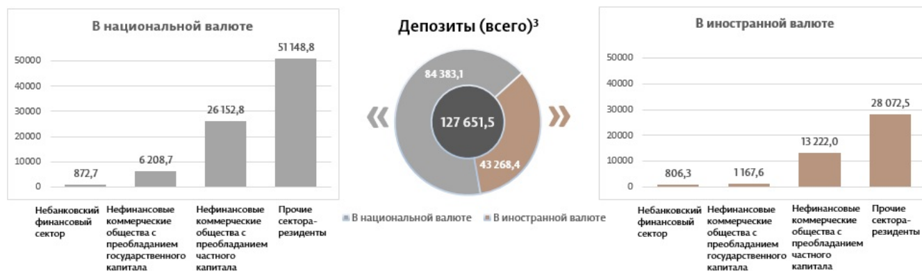
Диаграмма 3. Объём депозитов в феврале 2025 г. 7 , миллионы леев

Сальдо депозитов в национальной валюте увеличилось на 1 693,8 миллиона леев по сравнению с предыдущим месяцем, составив 84 383,1 миллиона леев, или 66,1% от общего сальдо депозитов. В то же время сальдо депозитов в иностранной валюте (пересчитанное в леях) увеличилось на 171,6 миллиона леев по сравнению с предыдущим месяцем, до уровня 43 268,4 миллиона леев, с долей 33,9% (диаграмма 3).