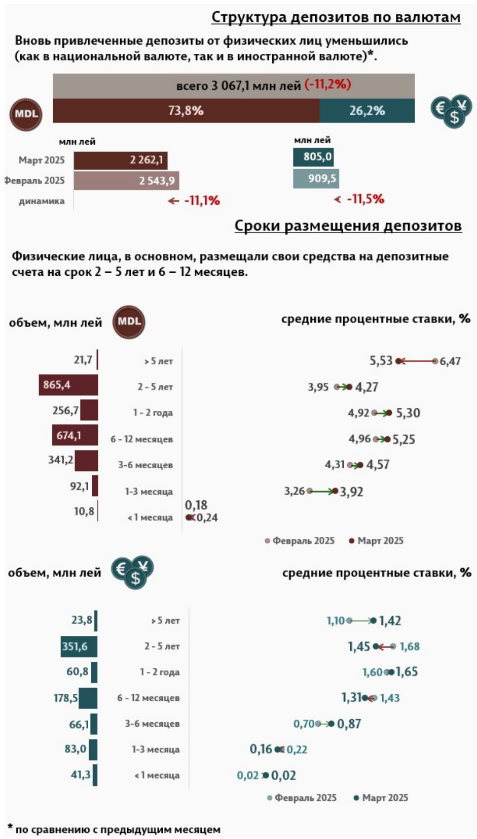
Инфографика 2. Вновь привлечённые срочные депозиты от физических лиц

2 до 5 лет с долей 39,7% и депозиты со сроком от 6 до 12 месяцев с долей 27,8% от общего объёма депозитов физических лиц. По сравнению с мартом 2024 г., объём вновь привлечённых депозитов от физических лиц в национальной валюте, увеличился на 63,6%, а в иностранной валюте на 13,6%.