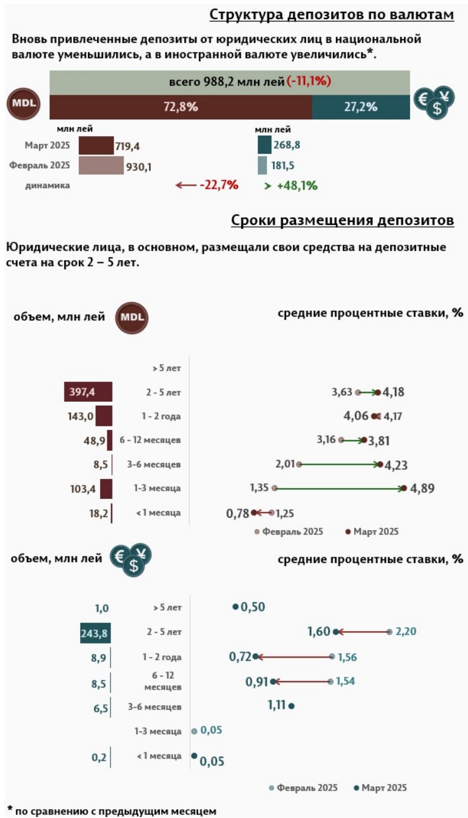
Инфографика 3. Вновь привлечённые срочные депозиты от юридических лиц

В марте 2025 г., по сравнению с предыдущим месяцем, объём депозитов юридических лиц в национальной валюте сократился на 22,7%, а в иностранной валюте увеличился на 48,1% (Инфографика 3). Депозиты юридических лиц в национальной валюте составили 719,4 миллиона леев, а в иностранной валюте – 268,8 миллиона леев. По сравнению с мартом 2024 г., объём депозитов юридических лиц в национальной валюте увеличился на 59,8%, а в иностранной валюте увеличился в 2,6 раза.