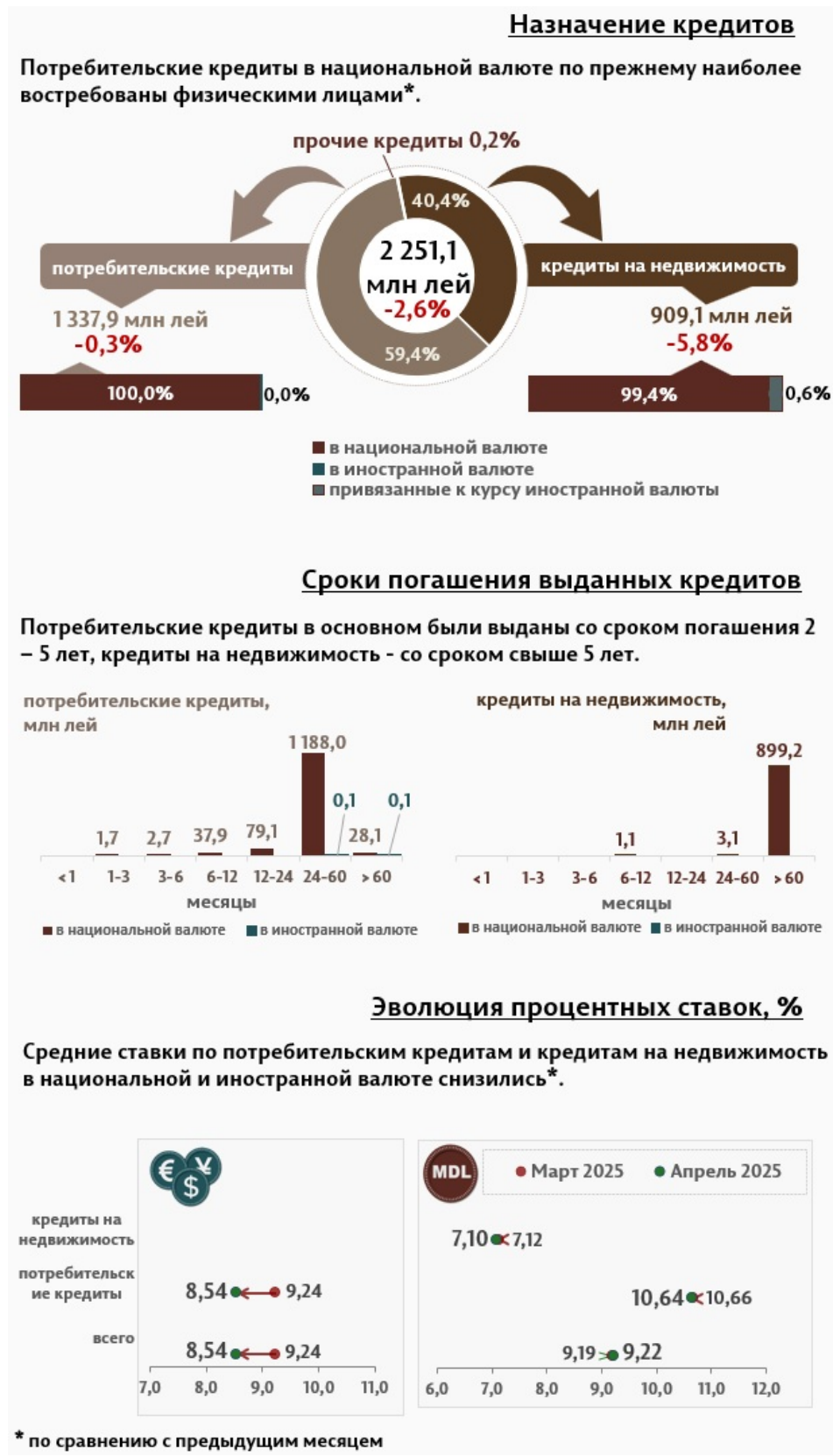
Инфографика 2. Вновь выданные кредиты физическим лицам

Кредиты на недвижимость были представлены в основном в национальной валюте и составляют 40,4% от общего объема кредитов, выданных физическим лицам.