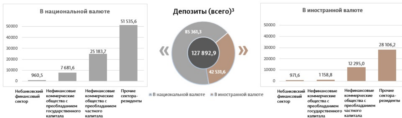
Диаграмма 3. Объём депозитов в апреле 2025 7 г., миллионы леев

Сальдо депозитов в национальной валюте увеличилось на 1 423,9 миллиона леев по сравнению с предыдущим месяцем, составив 85 361,3 миллиона леев, или 66,7% от общего сальдо депозитов. В то же время сальдо депозитов в иностранной валюте (пересчитанное в леях) уменьшилось на 145,3 миллиона леев по сравнению с предыдущим месяцем, до уровня 42 531,6 миллиона леев, с долей 33,3% (диаграмма 3).