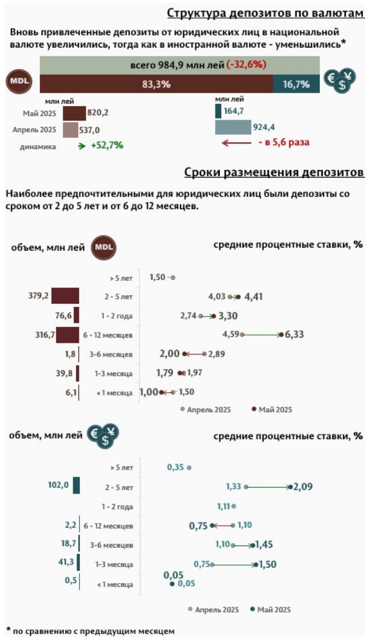
Инфографика 3. Вновь привлечённые срочные депозиты от юридических лиц

В мае 2025 г., по сравнению с предыдущим месяцем, объём депозитов юридических лиц в национальной валюте увеличился на 52,7%, тогда как в иностранной валюте сократился в 5,6 раза (Инфографика 3). Депозиты юридических лиц в национальной валюте составили 820,2 миллиона леев, а в иностранной валюте – 164,7 миллиона леев. По сравнению с маем 2024 г., объём депозитов юридических лиц в национальной валюте увеличился в 2,4 раза, тогда как в иностранной валюте – уменьшился на 37,9%.