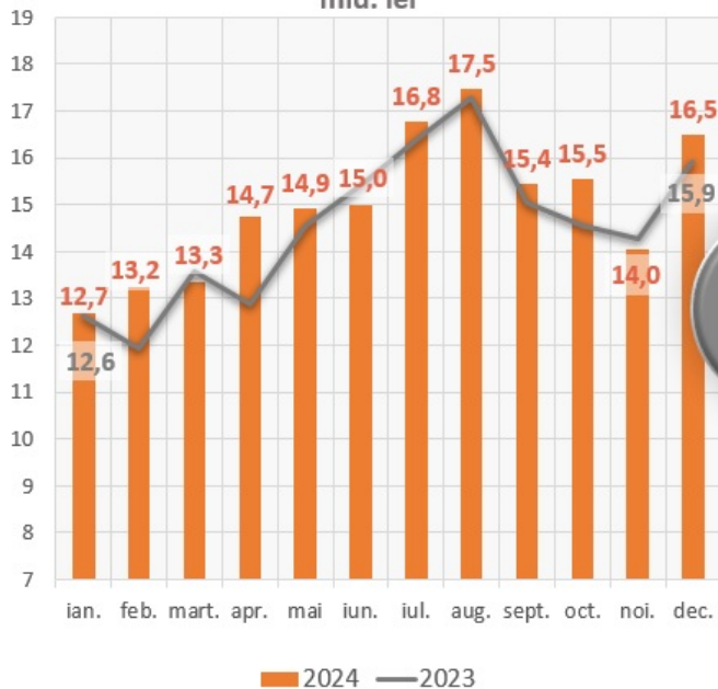
Dinamica lunară a eliberărilor banilor în numerar, mld. lei