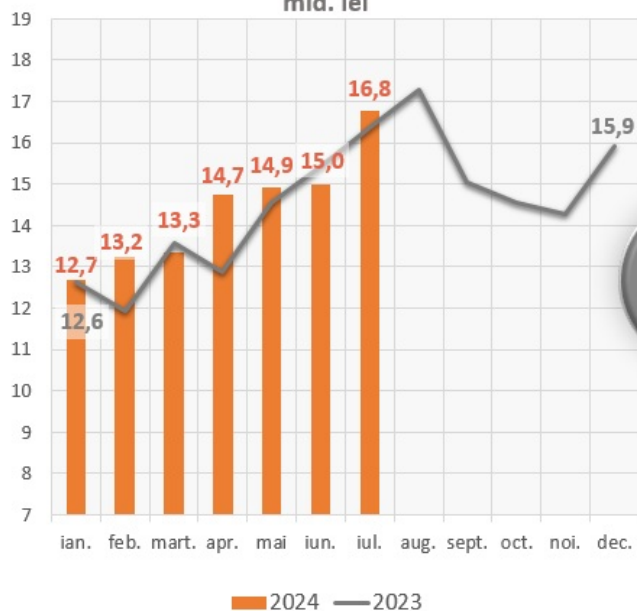
Dinamica lunară a eliberărilor banilor în numerar, mld. lei