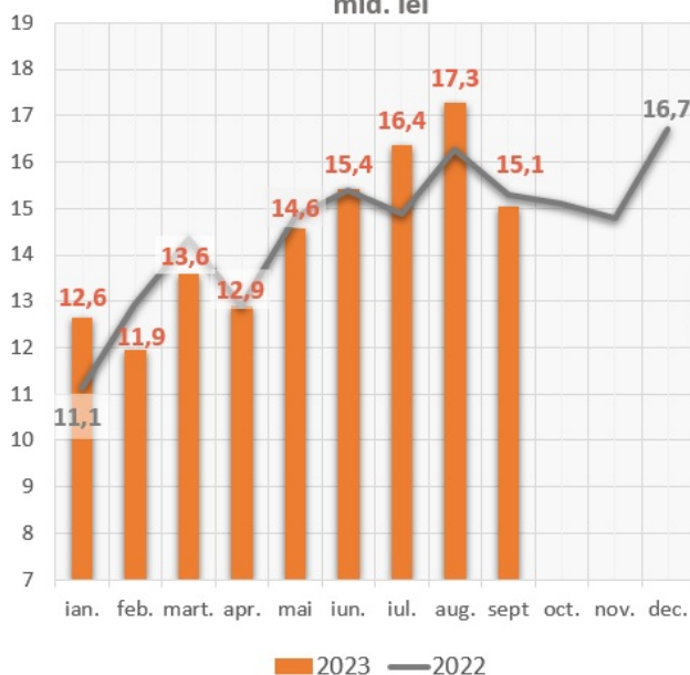
Dinamica lunară a eliberărilor banilor în numerar, mld. lei