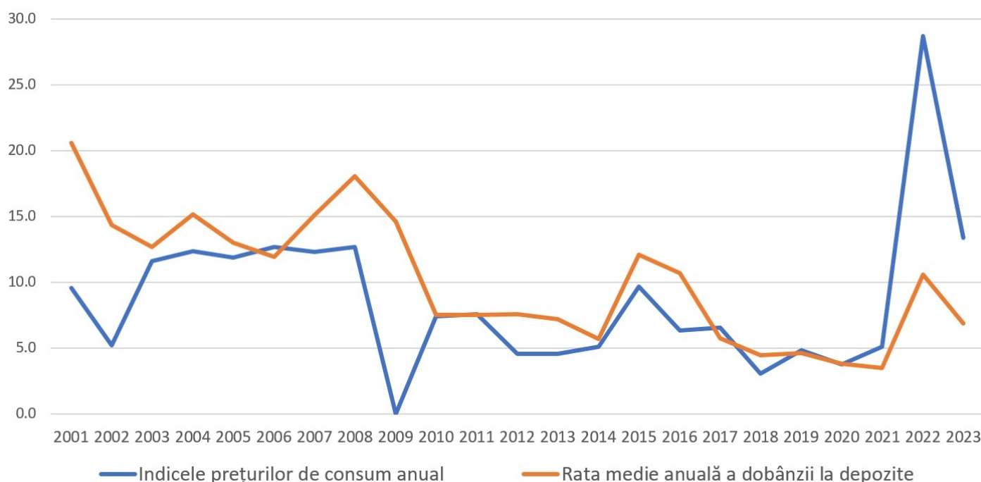
Graficul 1: Evoluția ratei medii anuale a dobânzii la depozite în lei moldovenești și a ratei inflației anuale

Prima soluție este plasarea banilor sub formă de depozite bancare pentru care se achită o dobândă ce compensează, cel puțin, o parte din efectele negative ale proceselor inflaționiste. Dobânda bancară, de cele mai multe ori, urmărește suficient de fidel procesele inflaționiste. Altfel, dacă dobânda ar fi prea mică față de inflație și riscul de erodare ar deveni prea mare, deponenții ar tinde să-și retragă economiile.