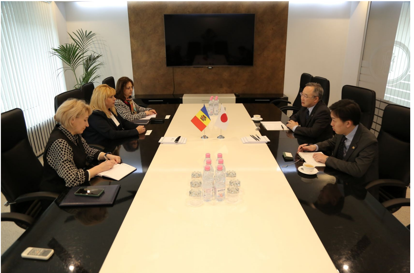
Tag-uri Ambasadorul Japoniei (1)