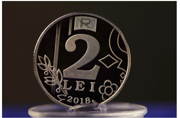
DOI LEI [2]