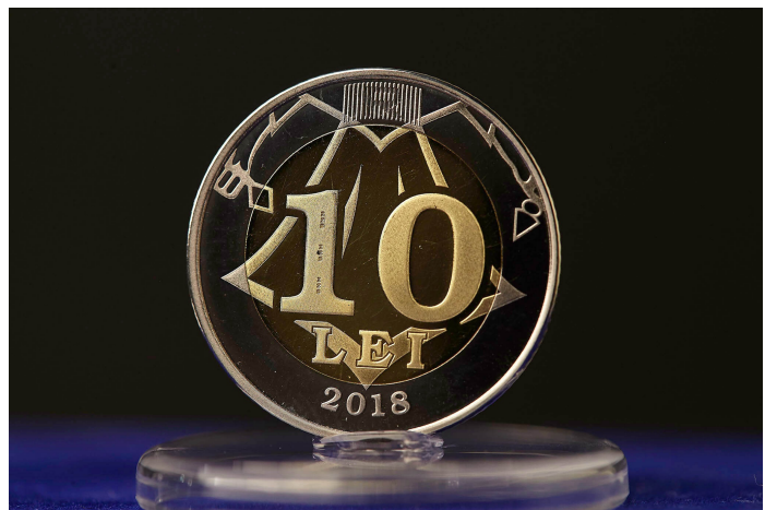
ZECE LEI [4]