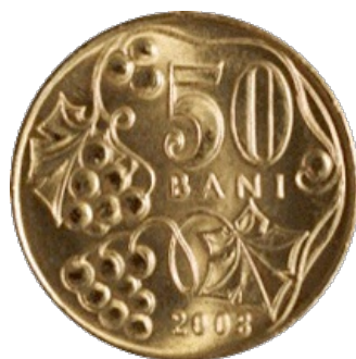
CINCIZECI BANI [13]