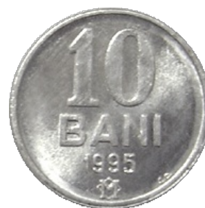
ZECE BANI [11]