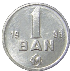
UN BAN [9]