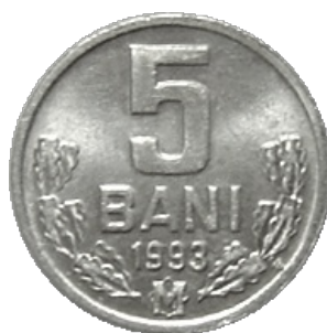
CINCI BANI [10]