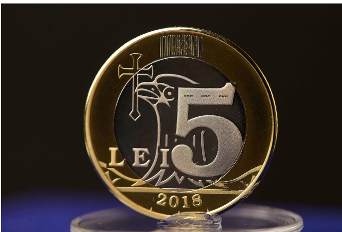
CINCI LEI [3]