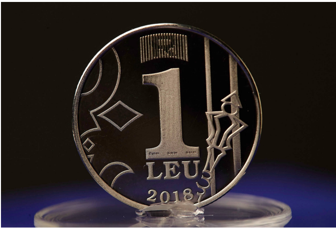
UN LEU [1]