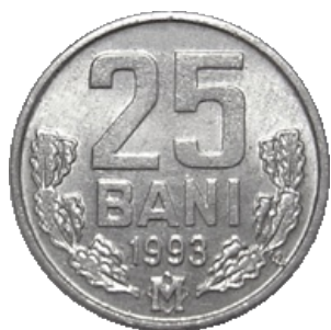
DOUĂZECI ȘI CINCI BANI [12]