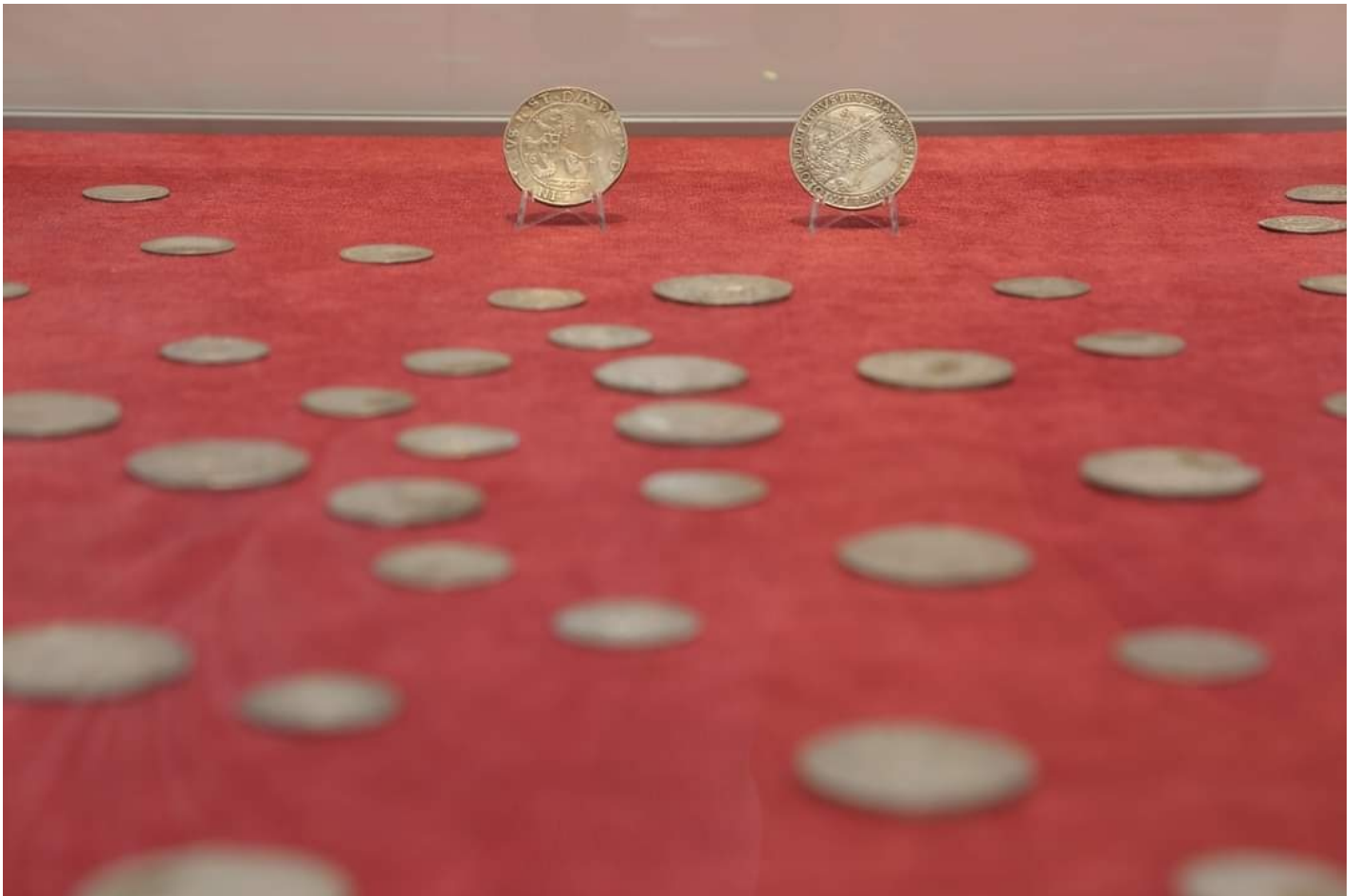
Tag-uri Monede vechi - monede noi [1]