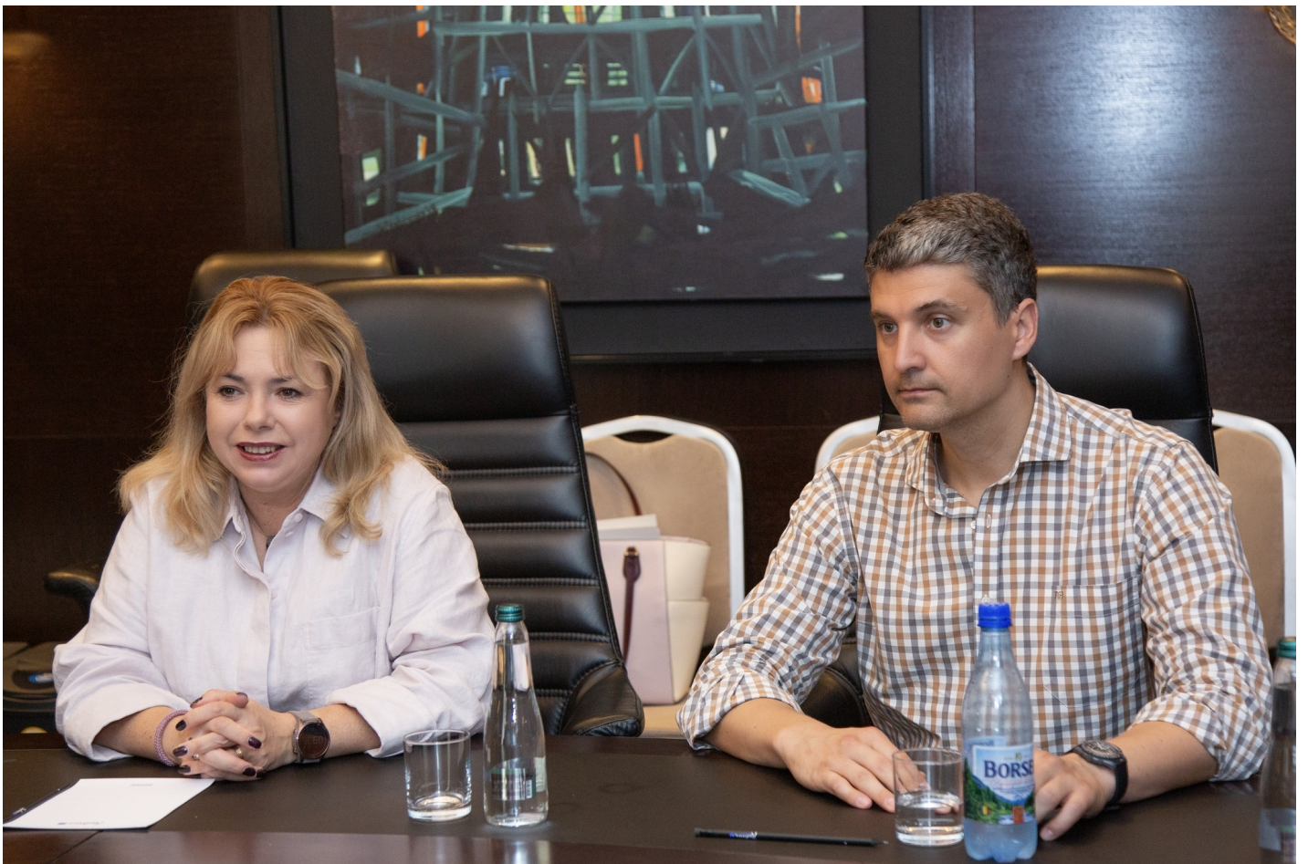
Reuniunea Constituenței Fondului Monetar Internațional și a Băncii Mondiale la Chișinău: