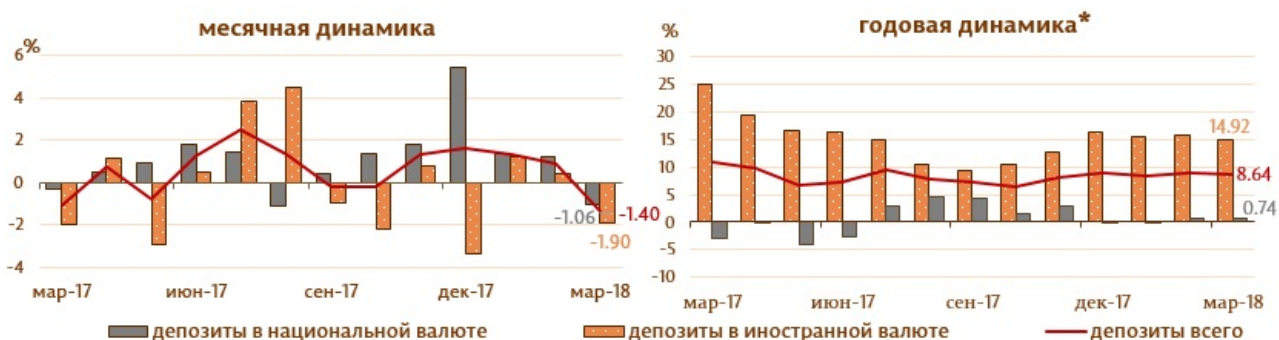
Диаграмма 2. Динамика депозитов Структура депозитов группируется по институциональным секторам в соответствии с Инструкцией о порядке составления и предоставления банками отчета по денежной статистике (Monitorul Oficial al Republicii Moldova nr. 206-215 din 2 decembrie 2011) [1]

Сальдо депозитов в национальной валюте снизилось на 367.8 млн. леев и составило 34455.9 млн. леев, составив долю 58.9% от общего сальдо депозитов, а сальдо депозитов в иностранной валюте (пересчитанное в леях) снизилось на 464.0 млн. леев, до уровня 24004.2 млн. леев, с долей 41.1% (диаграмма № 2).