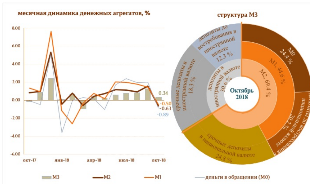
Диаграмма 1. Денежный агрегат M3

Следует отметить, что денежные агрегаты Деньги в обращении (M0) и Денежная масса (M1) 5 выросли по отношению к октябрю 2017 года на 7.5 и на 12.5%, соответственно.