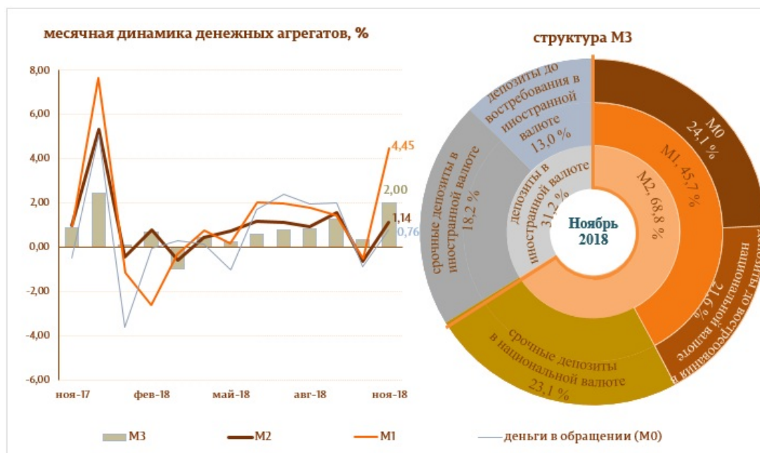
Диаграмма 1. Денежный агрегат M3

Следует отметить, что денежные агрегаты Деньги в обращении (M0) и Денежная масса (M1) 5 выросли по отношению к ноябрю 2017 года на 8,9 и 16,3%, соответственно.