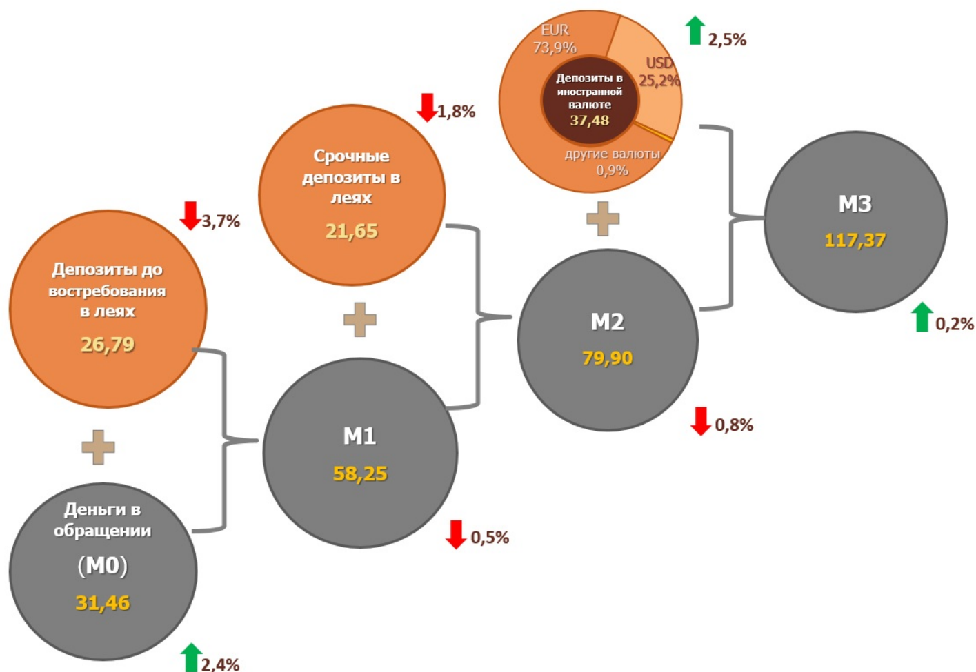
Диаграмма 1. Динамика денежной массы в феврале 2022 по сравнению с предыдущим месяцем, млрд. леев 3

Денежная масса M1 4 уменьшилась на 290,3 млн. леев, или на 0,5% по сравнению с январём 2022 г. и составила 58 246,6 млн. леев, будучи на 4,3% выше, чем в аналогичном периоде прошлого года.