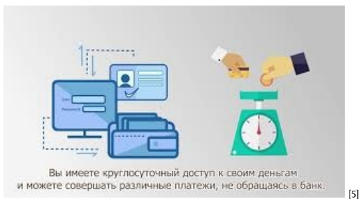
Как безопасно использовать свою платежную карту [5]