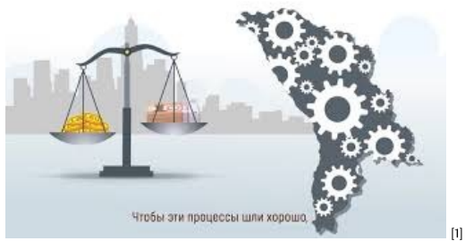
Роль Национального банка Молдовы [1]