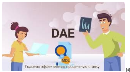
На что обращать внимание при получении кредита [4]