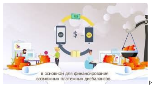
Зачем стране нужны валютные резервы [8]