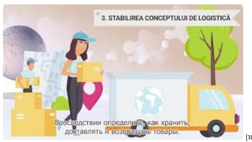
Как начать онлайн-бизнес [10]