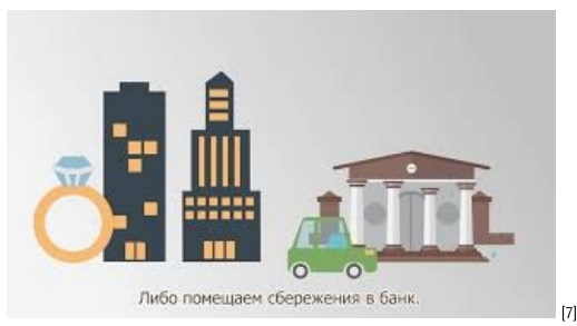
От сбережений к инвестициям [7]