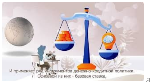
Почему принимаются решения по денежно-кредитной политике [2]