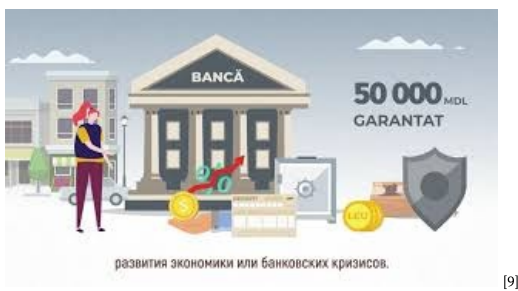
В чем разница между банковским и небанковским секторами [9]