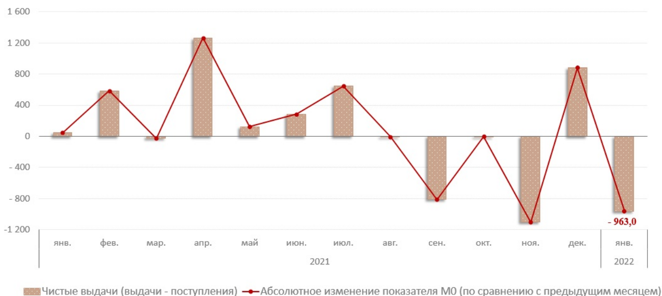
Диаграмма № 1. Взаимосвязь показателя M0 с объемом кассовых операций по банковской системе, млн. леев

В январе 2022 г. объем денежных поступлений увеличился на 24,5% по сравнению с аналогичным периодом прошлого года и составил 12 099,6 млн. леев. Увеличение объема денежных поступлений в основном обусловлено увеличением на 18,1% поступлений от реализации потребительских товаров (независимо от каналов их реализации), которые имеют наибольшую долю (52,3%) в объеме общих поступлений (Диаграмма №2). Данная эволюция была подкреплена увеличением практически всех источников денежных поступлений.