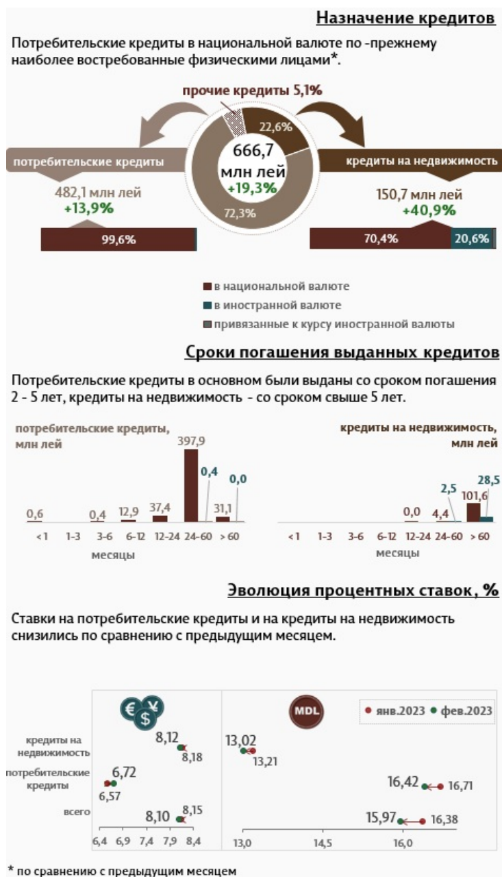
Инфографика 2. Вновь выданные кредиты физическим лицам

Кредиты на недвижимость составляют 22,6% от всех кредитов, выданных физическим лицам, и были предоставлены в основном в национальной валюте (70,4% от общего объема кредитов на недвижимость).