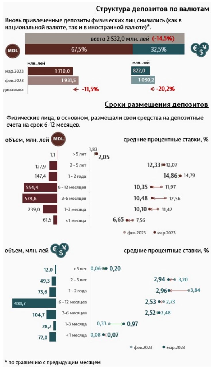
Инфографика 2. Вновь привлеченные срочные депозиты от физических лиц

Депозиты физических лиц в марте 2023 года составили 2 532,0 миллиона леев, уменьшившись на 14,5% по сравнению с предыдущим месяцем (Инфографика 2).