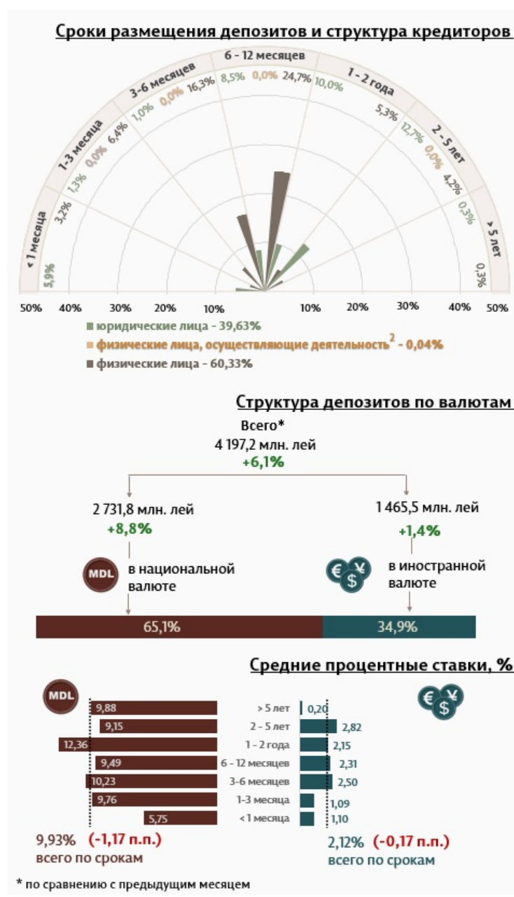
Инфографика 1. Динамика вновь выданных депозитов

Средняя номинальная ставка по новым депозитам, привлеченным в национальной валюте, снизилась на 1,17 процентных пункта по сравнению с предыдущим месяцем и составила 9,93%. Средняя номинальная ставка по депозитам в иностранной валюте снизилась на 0,17 процентных пункта, составив 2,12%.