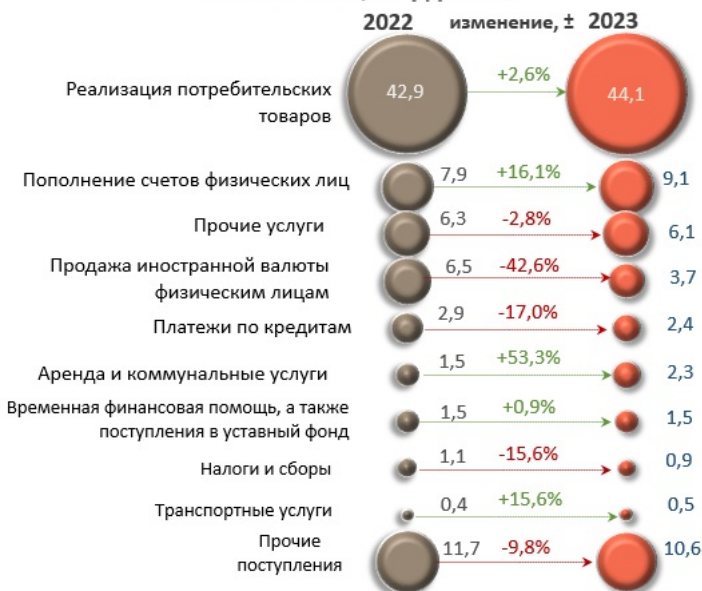
Основные источники денежных поступлений, за январь – июнь 2023 г., млрд леев