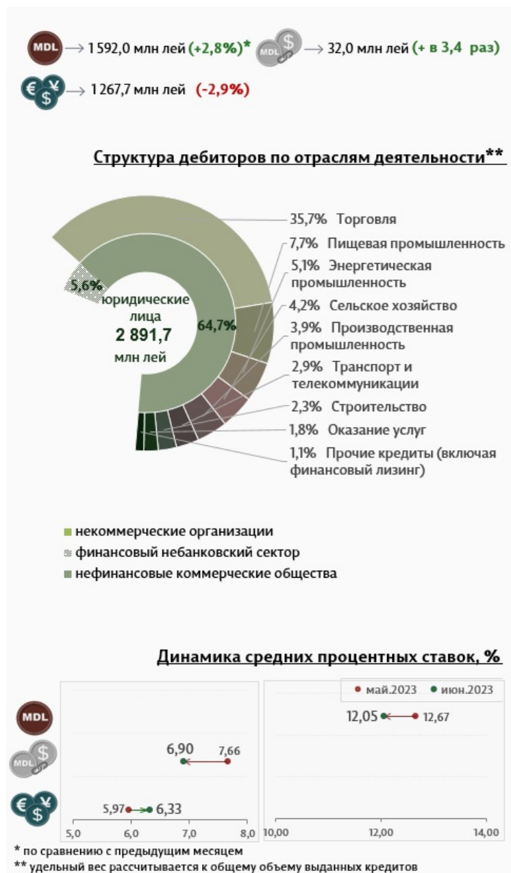
Инфографика 3. Вновь выданные кредиты юридическим лицам.

Средняя ставка по кредитам, выданным юридическим лицам в национальной валюте, снизилась на 0,62 процентных пункта, до уровня 12,05% (инфографика 3). В то же время средняя ставка по кредитам, выданным в иностранной валюте, увеличилась на 0,36 процентных пункта и составила 6,33%.