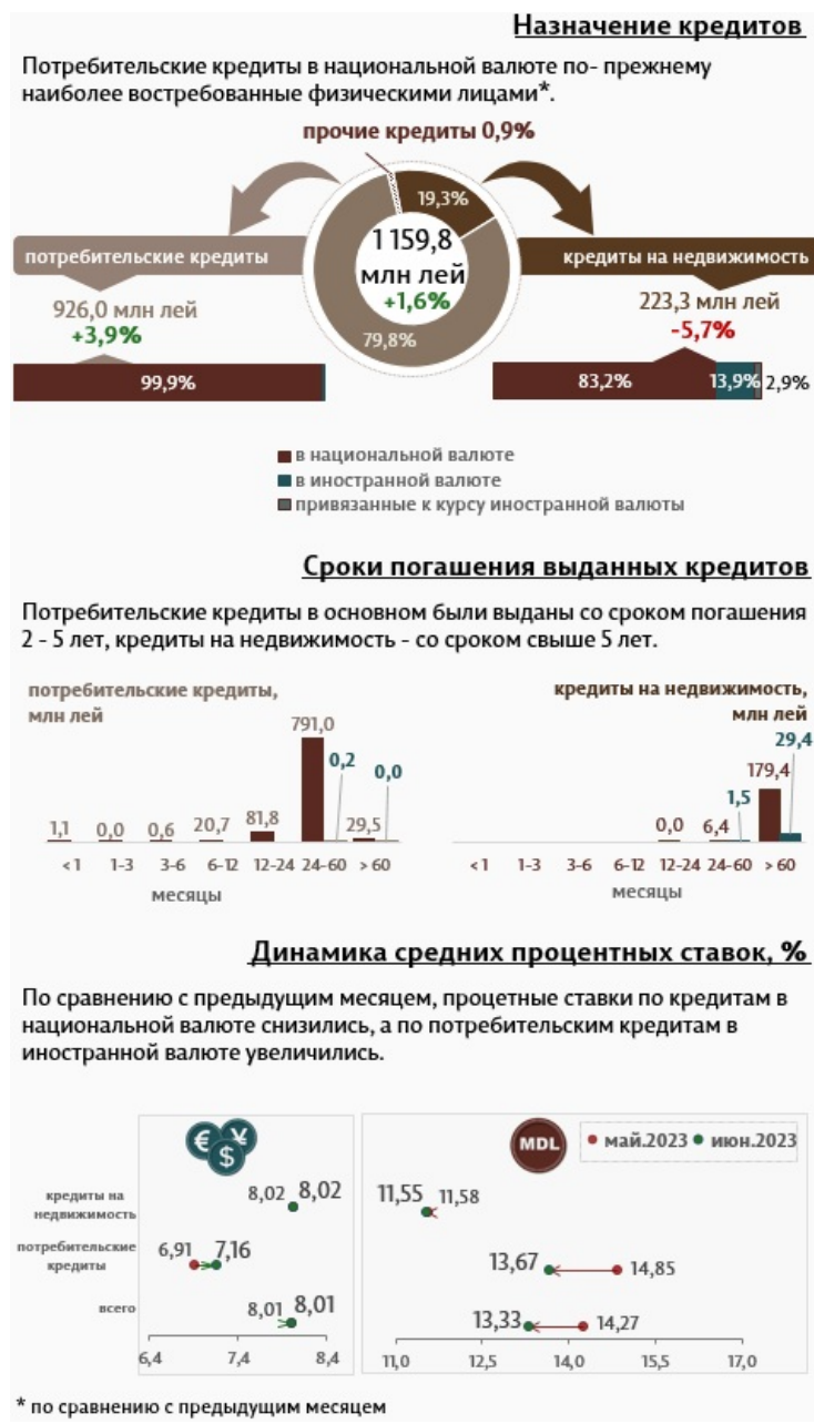
Инфографика 2. Вновь выданные кредиты физическим лицам.

Физические лица в июне 2023 года получили кредиты в объеме 1 159,8 миллиона леев, на 1,6% выше по сравнению с предыдущим месяцем, большая часть (79,8%) была предоставлена на потребление (Инфографика 2). Наибольшая часть этих кредитов (791,0 миллиона леев) была выдана в национальной валюте на срок от 2 до 5 лет.