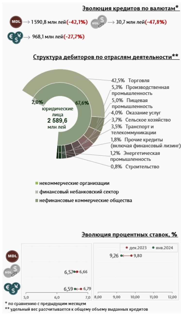
Инфографика 3. Вновь выданные кредиты юридическим лицам

Средняя ставка по кредитам, выданным юридическим лицам в национальной валюте, снизилась на 0,54 процентных пункта, до уровня 9,26%. В то же время средняя ставка по кредитам, выданным в иностранной валюте, уменьшилась на 0,20 процентных пункта и составила 6,59%.