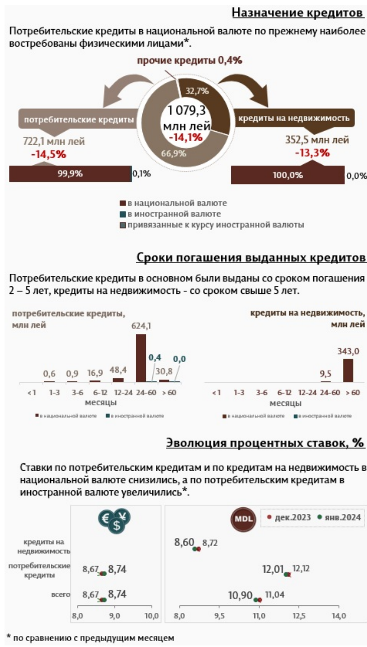
Инфографика 2. Вновь выданные кредиты физическим лицам 3

Кредиты на недвижимость составляют 32,7% от всех кредитов, выданных физическим лицам, и были представлены в основном в национальной валюте (100,0% от общего объема кредитов на недвижимость).