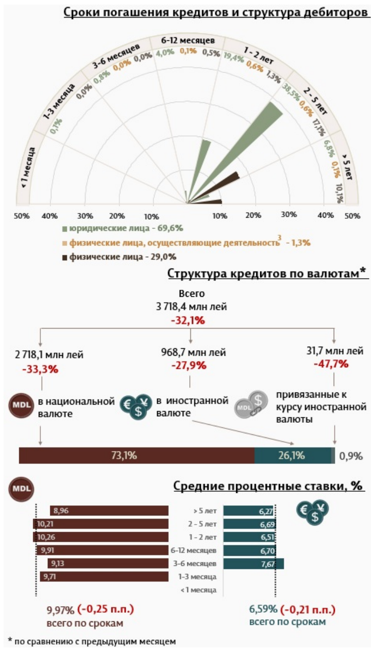
Инфографика 1. Динамика вновь выданных кредитов 2

В январе 2024 г. вновь выданные кредиты 1 составили 3 718,4 миллиона леев, на 32,1% ниже декабря 2023 г. (Инфографика 1). Основная часть (73,1%) пришлась на кредиты в национальной валюте, которые составили 2 718,1 миллиона леев, на 33,3% ниже по сравнению с предыдущим месяцем.