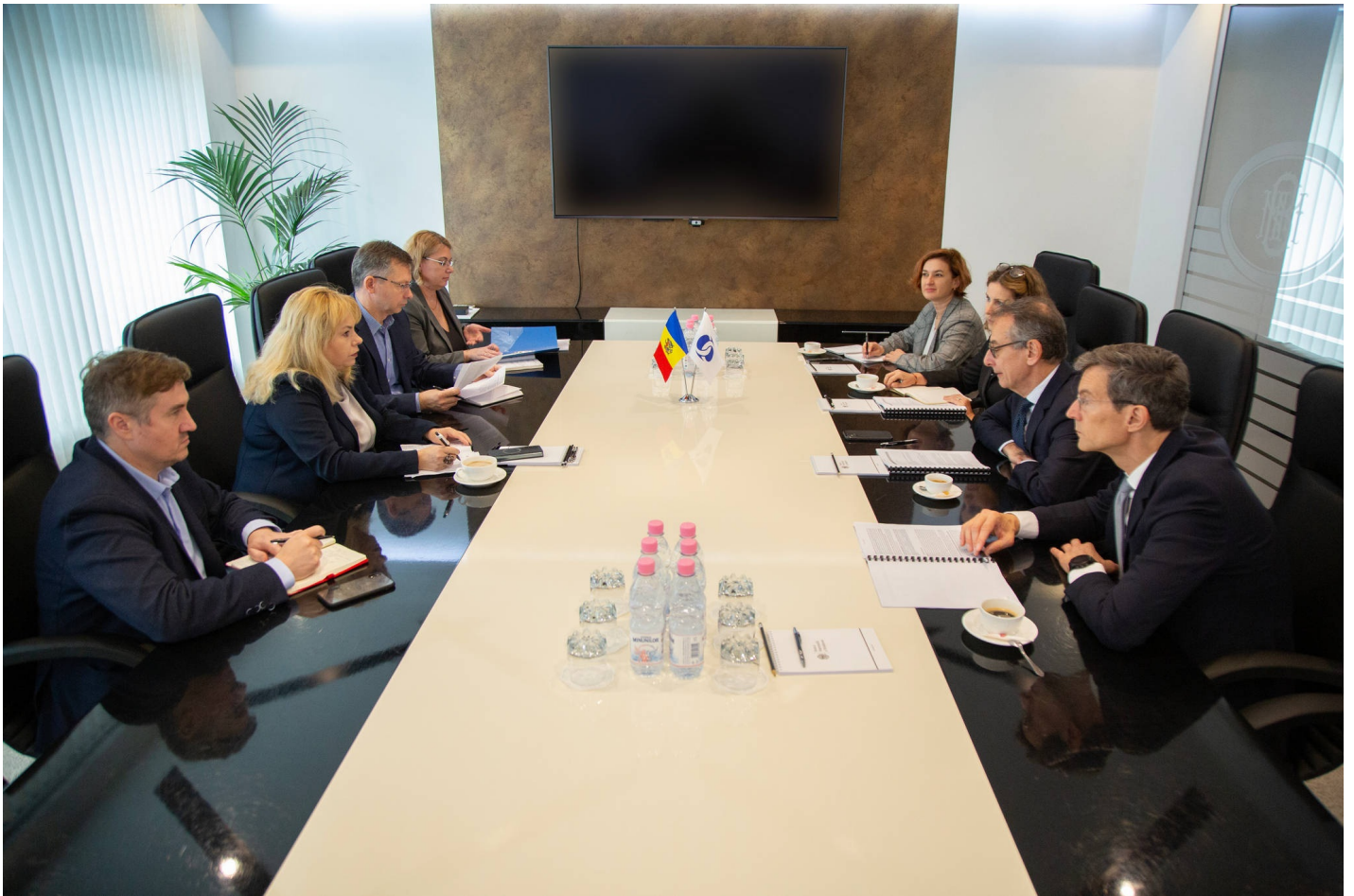
Таг-ури встреча с делегацией ЕБРР [1]