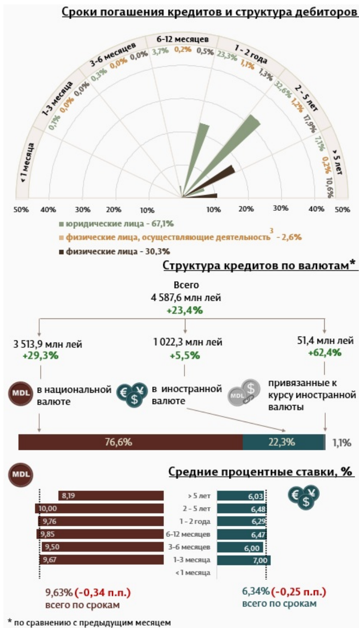
Инфографика 1. Динамика вновь выданных кредитов 2

В феврале 2024 г. вновь выданные кредиты 1 составили 4 587,6 миллиона леев, на 23,4% выше января 2024 г. (Инфографика 1). Основная часть (76,6%) пришлась на кредиты в национальной валюте, которые составили 3 513,9 миллиона леев, на 29,3% выше по сравнению с предыдущим месяцем.