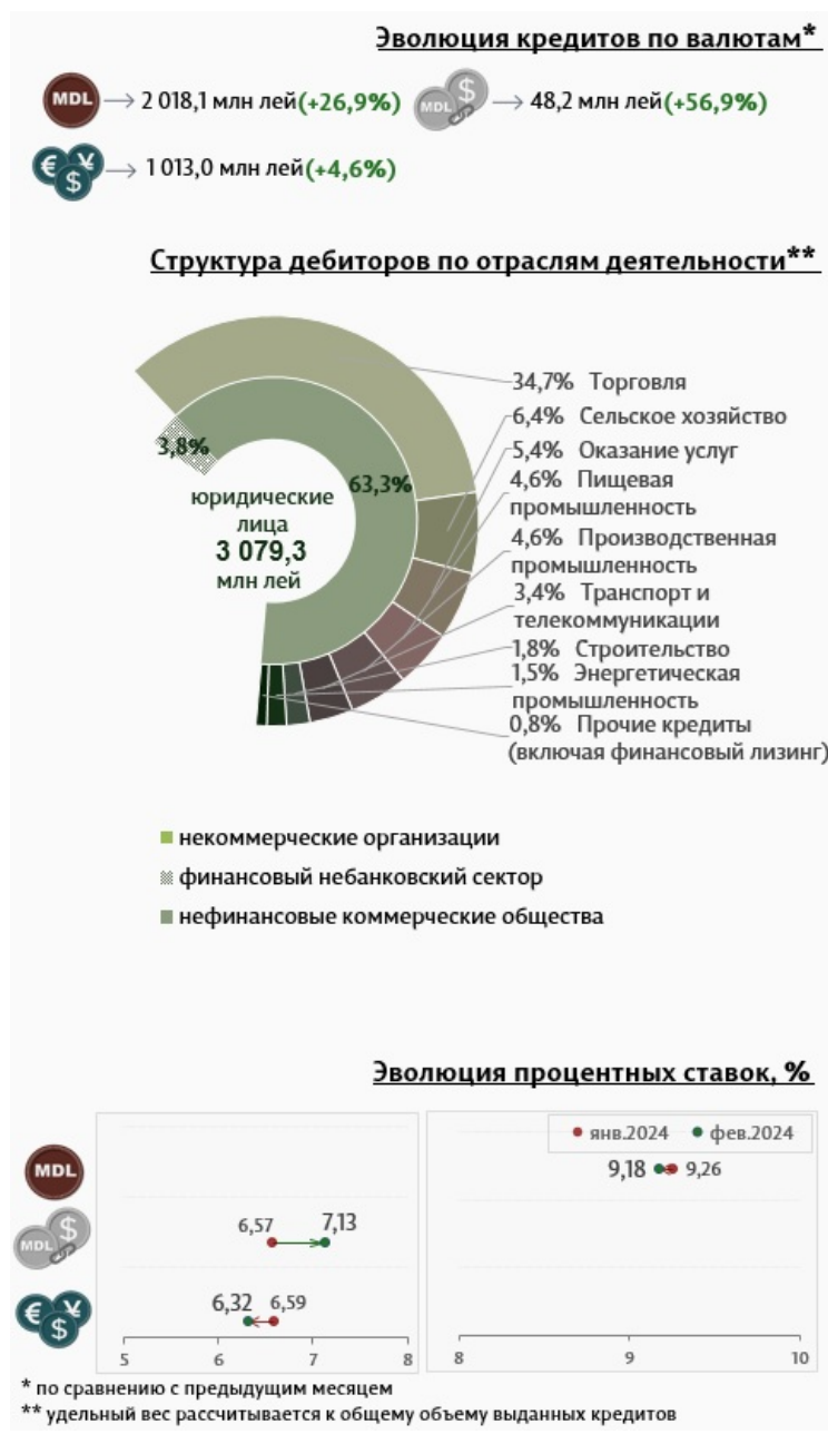
Инфографика 3. Вновь выданные кредиты юридическим лицам

Средняя ставка по кредитам, выданным юридическим лицам в национальной валюте, снизилась на 0,08 процентных пункта, до уровня 9,18%. В то же время средняя ставка по кредитам, выданным в иностранной валюте, уменьшилась на 0,27 процентных пункта и составила 6,32%.