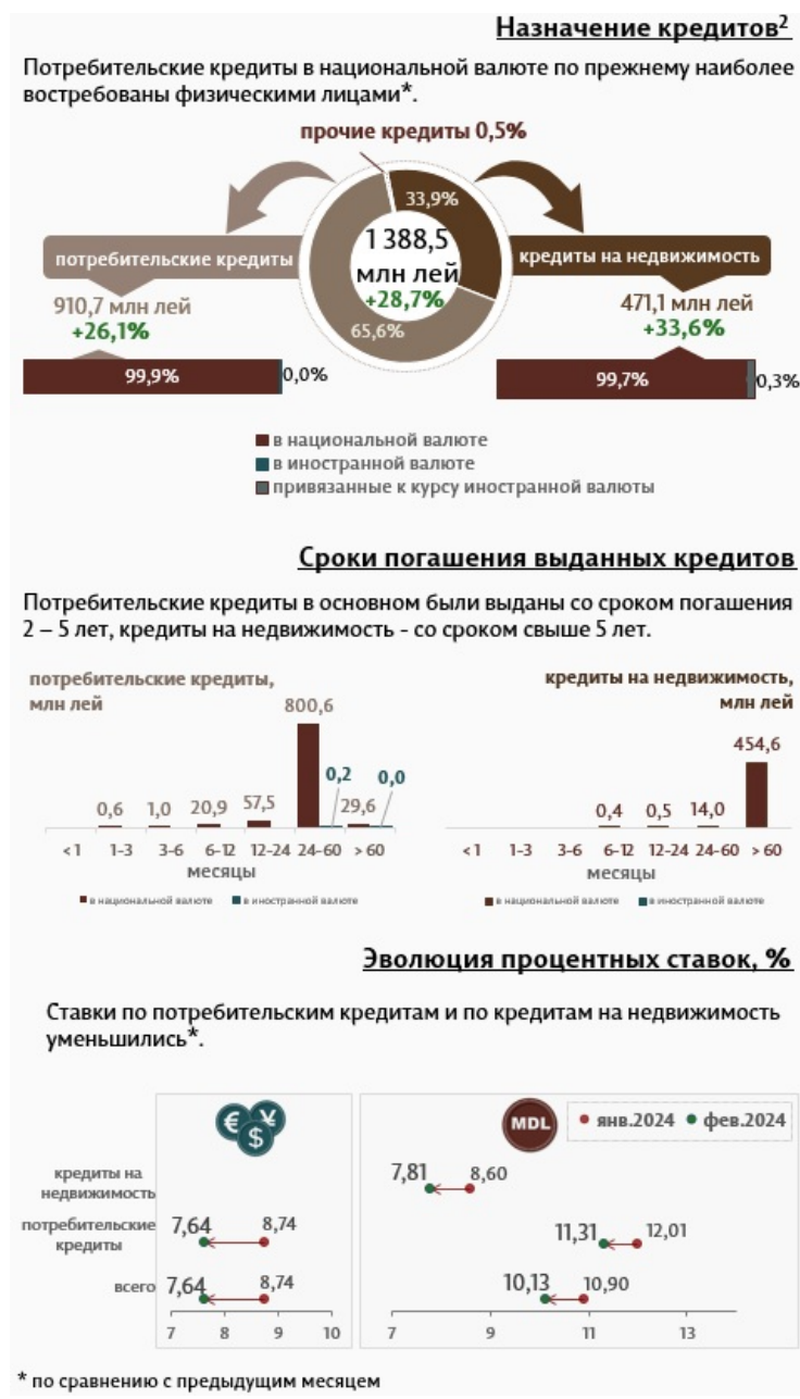
Инфографика 2. Вновь выданные кредиты физическим лицам 3

Кредиты на недвижимость составляют 33,9% от всех кредитов, выданных физическим лицам, и были представлены в основном в национальной валюте (99,7% от общего объема кредитов на недвижимость).