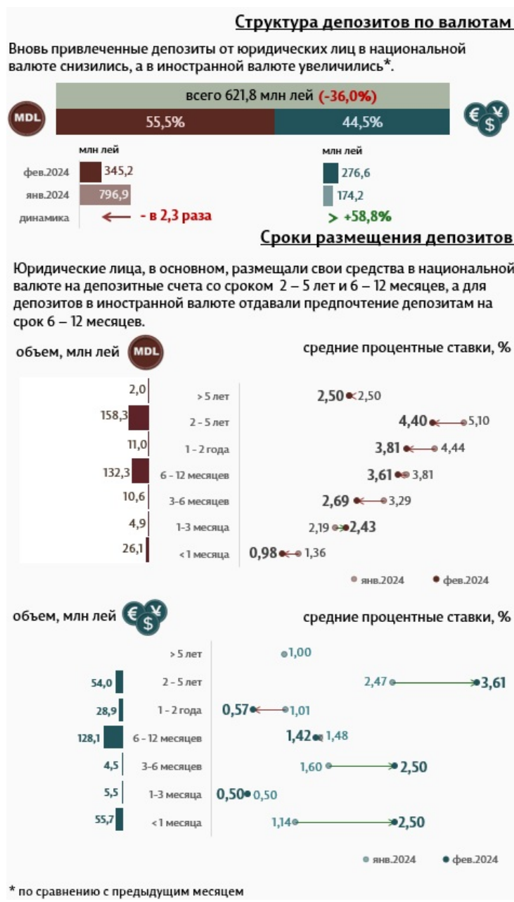
Инфографика 3. Вновь привлеченные срочные депозиты от юридических лиц

Депозиты юридических лиц в национальной валюте составили 345,2 миллиона леев, а в иностранной валюте – 276,6 миллиона леев.